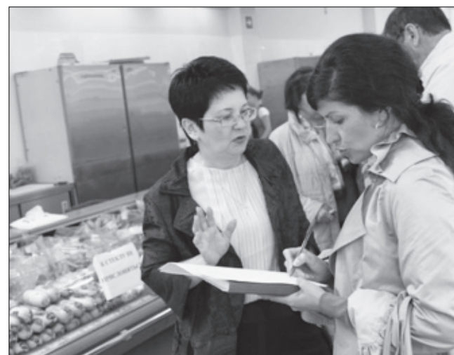
Страницу подготовила Светлана ТИХОНЕНКО.

В любом случае добросовестному продавцу не страшны никакие проверки, если они проходят в рамках закона. Неожиданные визиты «ревизоров» будут лишь способствовать очищению рынка от нечистых на руку предпринимателей, некачественных товаров и услуг.