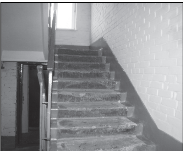
Подъезд дома № 20 на улице 60 лет Октября теперь радуется жильцов свежими красками.