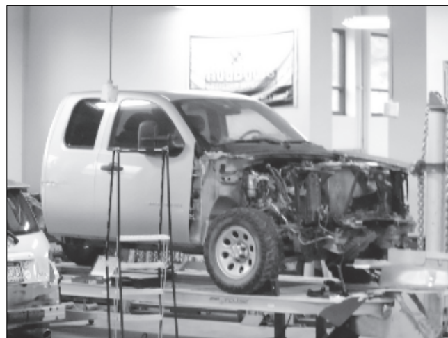
В центре профориентации старшеклассники могут выучиться на автомеханика.

ются в специальные некоммерческие организации, члены которых идут в семью и узнают, что случилось.