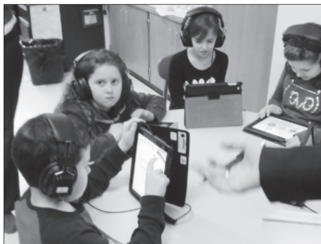
Частенько дети в классе сидят группами за круглым столом.