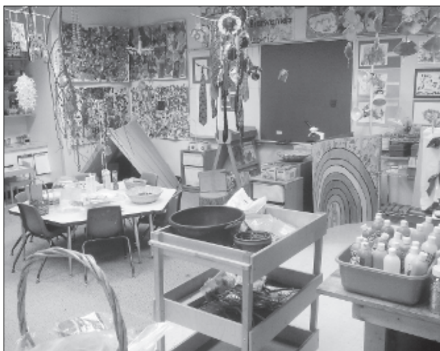
Наглядности в классе — хоть отбавляй!