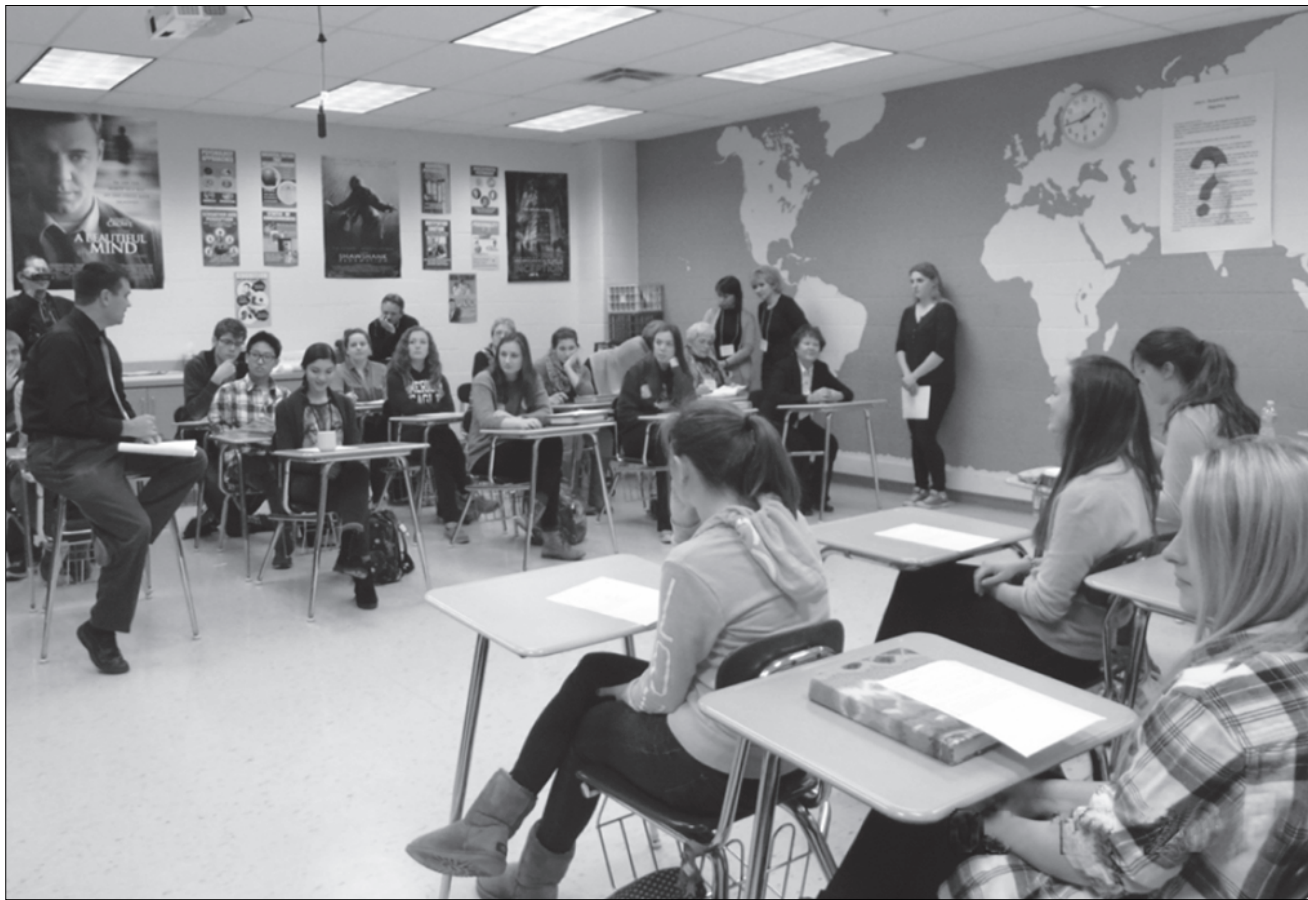
Американский учитель может вести урок, сидя на столе.

В американской школе царит демократизм. Свободная форма одежды — лишь бы было комфортно. Свободное поведение: учитель может вести урок, сидя на парте, а ребенок вправе пересечь на более удобное место и,