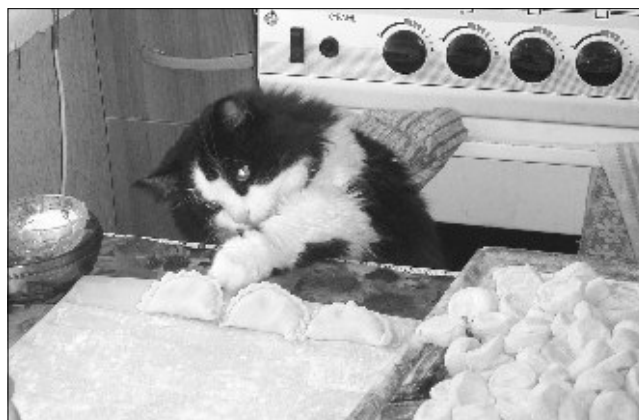
Лепить пельмени хозяйке помогает домашний любимец.

— С детства люблю петь. Как стала говорить, так сразу и запела. Как-то завклубом повез деревенских на олимпиаду — и меня, пятилетнюю, тоже. Вышла на сцену, а стула-то, на который я всегда забиралась, когда выступала дома, нет! Как петь без стула?..