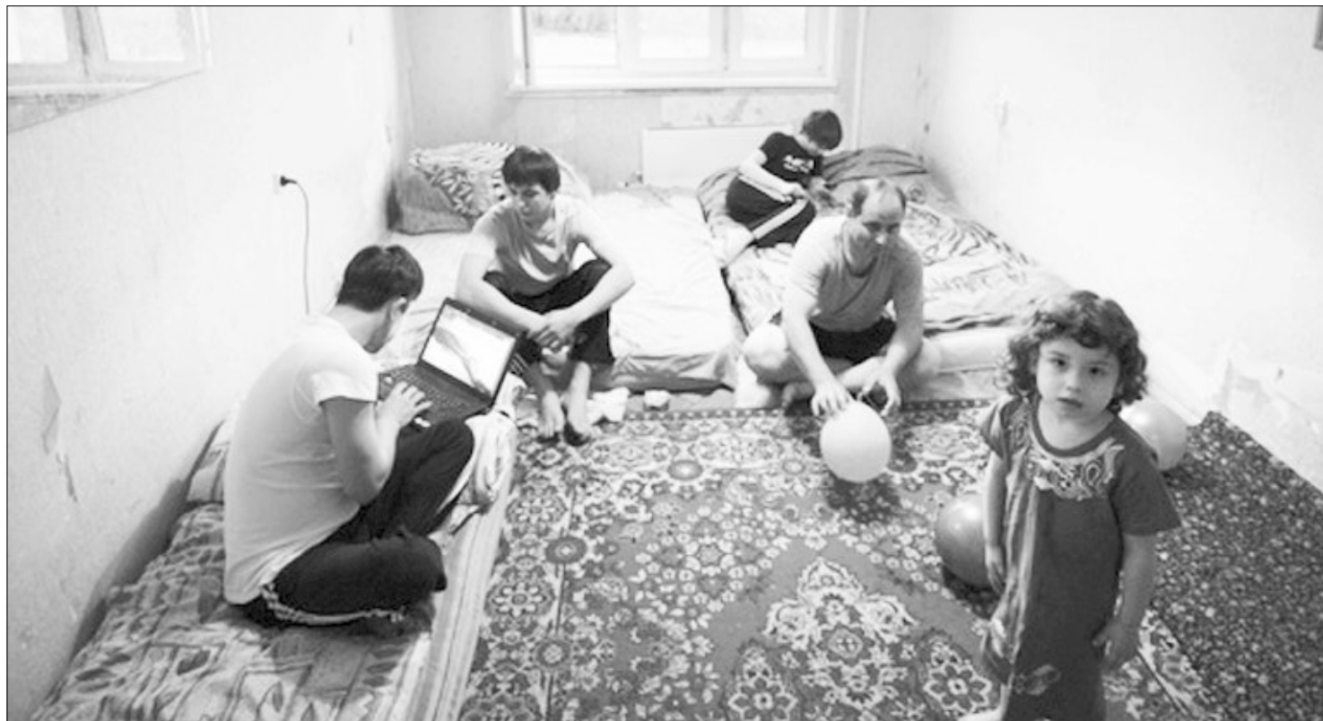
Отвечать за нарушение закона придется и хозяевам квартир, и их постояльцам.

По российскому законодательству каждый гражданин и иностранный гость для того, чтобы поступить в вуз, попасть на прием к врачу, устроиться на работу, должен иметь регистрацию по месту жительства. Однако многие не могут ее оформить в силу отсутствия своего жилья. Поэтому люди вынуждены платить «даде», который их зарегистрирует, либо же искать тех, кто согласится им помочь за «спасибо».