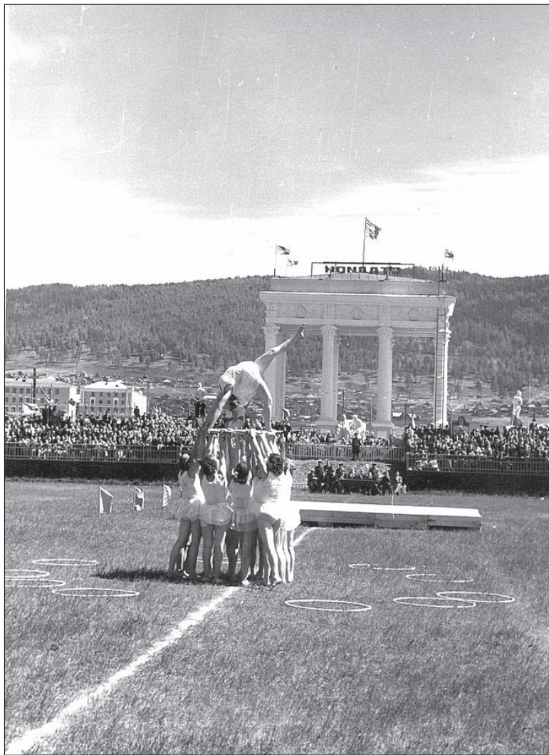
1956 год. День физкультурника.

В декабре 1919 г. Миасский завод получил статус уездного города, но, официально уже именуясь Миассом, он никогда