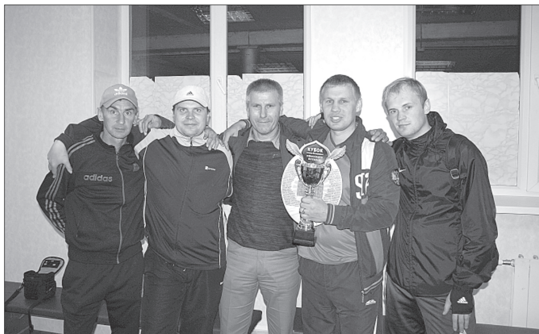
Создатель команды, тренер, ведущие игроки — именно они внесли главный вклад в победу.

Позавчера на стадионе «Труд» состоялся финальный матч Кубка ветеранов миасского футбола, в котором встретились команды «Лотор» и «ЦСМ». В течение двух таймов и дополнительного времени шла напряженная игра, но счет так и не был открыт. В итоге судья назначил серию пенальти, в которой победу вырвали игроки «Лотора».