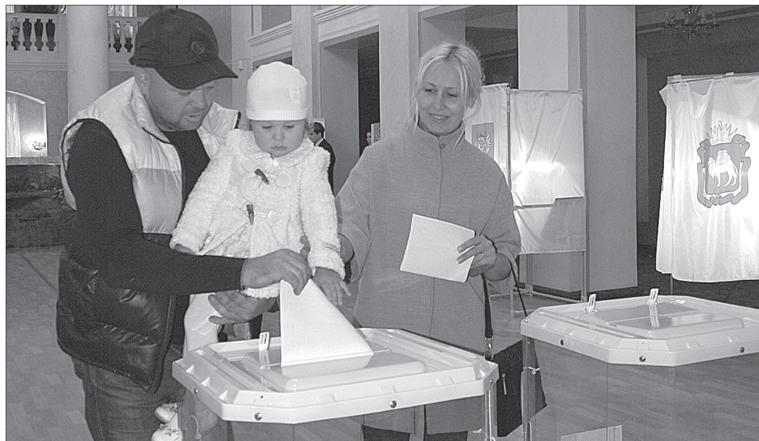
Показатель активности южноуральских избирателей — выше среднего по России.

Впервые за десять лет в Челябинской области в воскресенье прошли выборы губернатора. Сейчас в региональной избирательной комиссии уже подведены предварительные итоги: с большим преимуществом лидирует Борис Дубровский, за которого проголосовало около миллиона жителей Южного Урала.