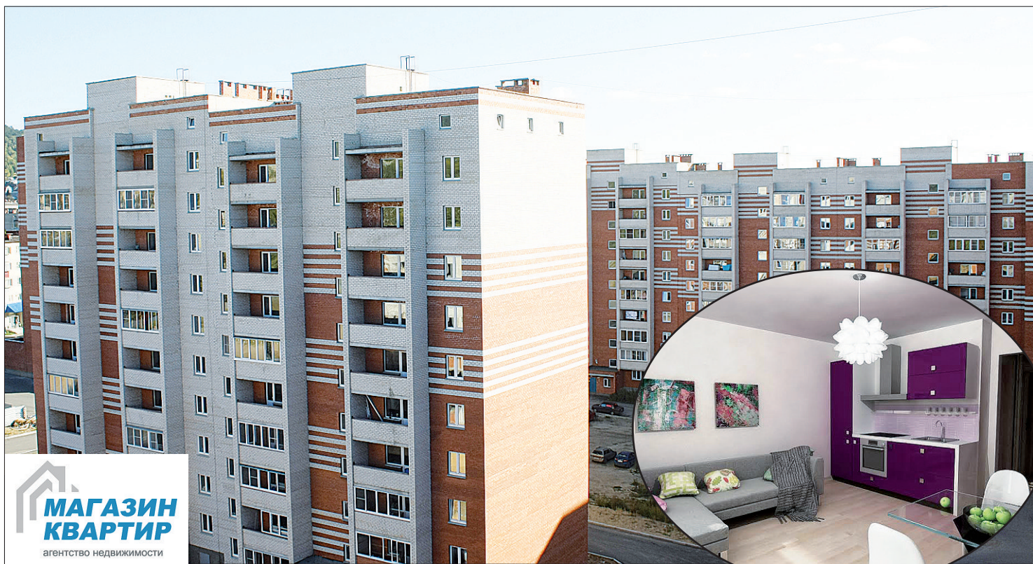
В новых домах есть все условия для достойной жизни.

Строительная компания «Проминвест» помогает миассцам обрести уютный семейный очаг