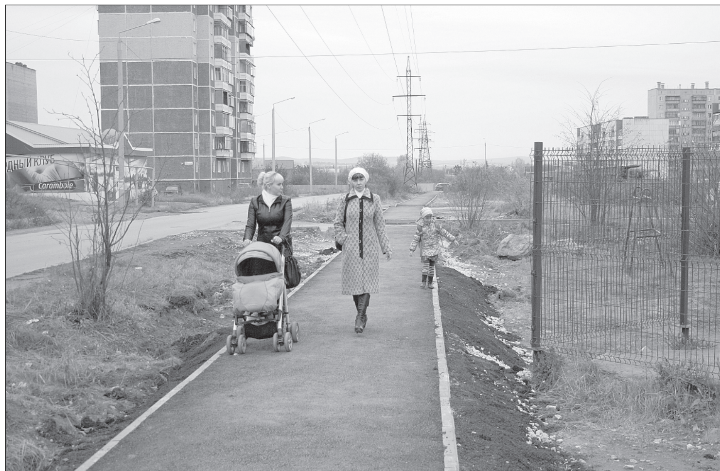
Благоустройство Комарово не закончено: вдоль тротуаров скоро появятся газоны.

Жители района Комарово теперь могут ходить не по краю проезжей части, а по нормальным тротуарам без риска для жизни