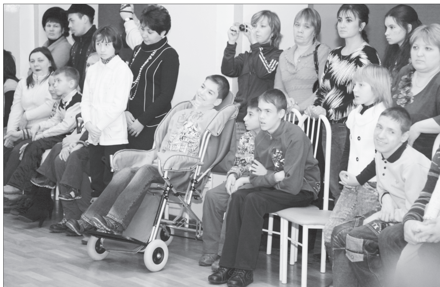
Всей своей деятельностью сотрудники фонда доказывают особым детям: «Ты удивительный, уникальный, неповторимый!»

Первого ноября в Миассе стартует пилотный проект для детей и подростков с инвалидностью