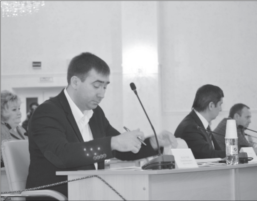
Документу предстоит пройти еще второе и третье чтения, после чего он будет представлен в область.

Депутаты в первом чтении приняли дефицитный бюджет