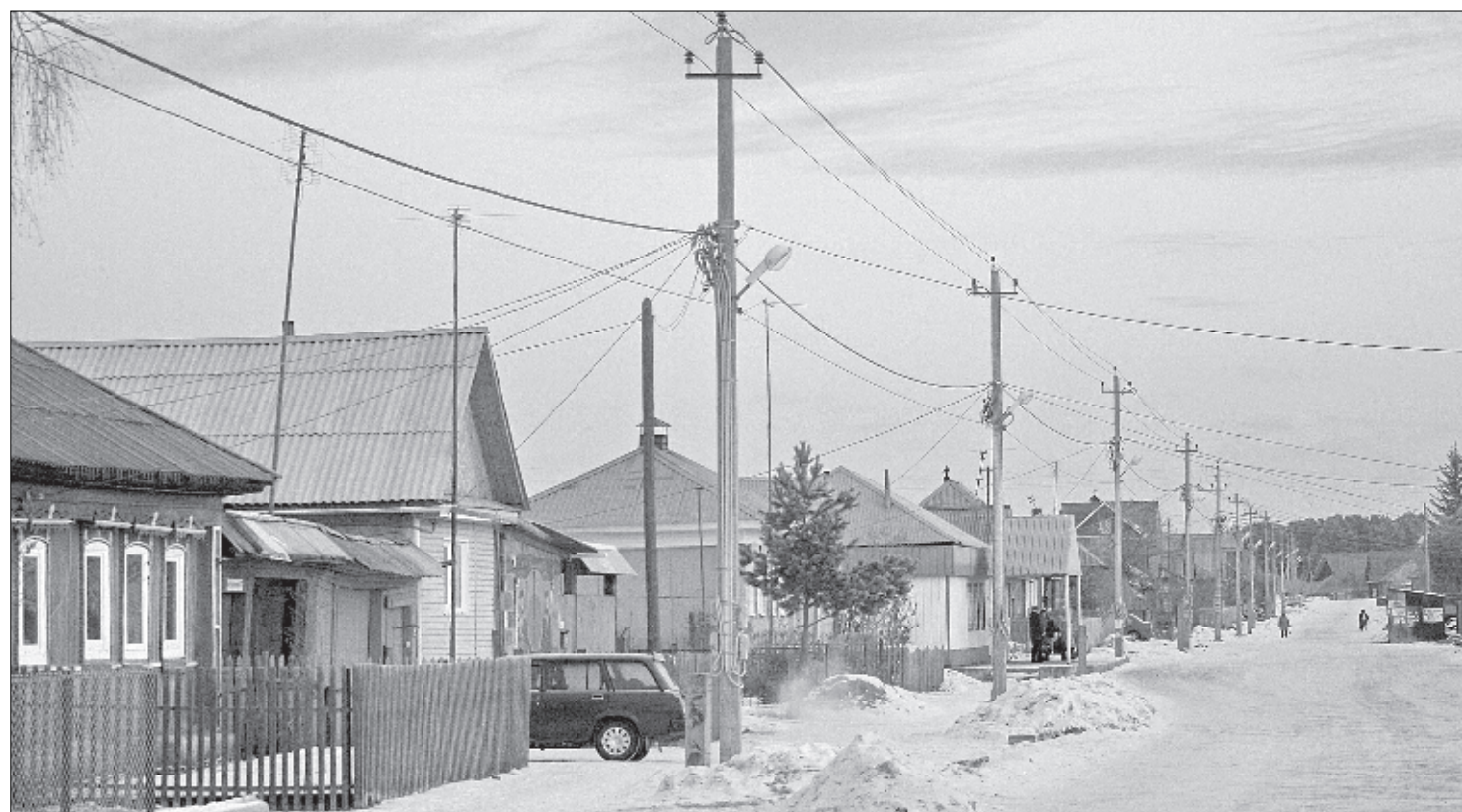
Терпение жителей иссякло, когда ремонт закончился, а нормального электроснабжения как не было, так и нет.

Когда в домах и на улицах Новотагилки загорается свет, у жителей праздник