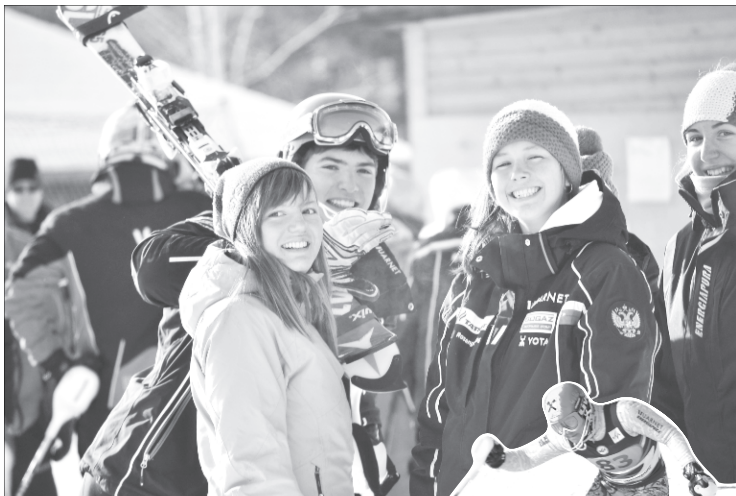
Участники Кубка высоко оценили условия и готовность трассы.

Азам катания на горных лыжах воспитанников интерната учили профессиональные спортсмены