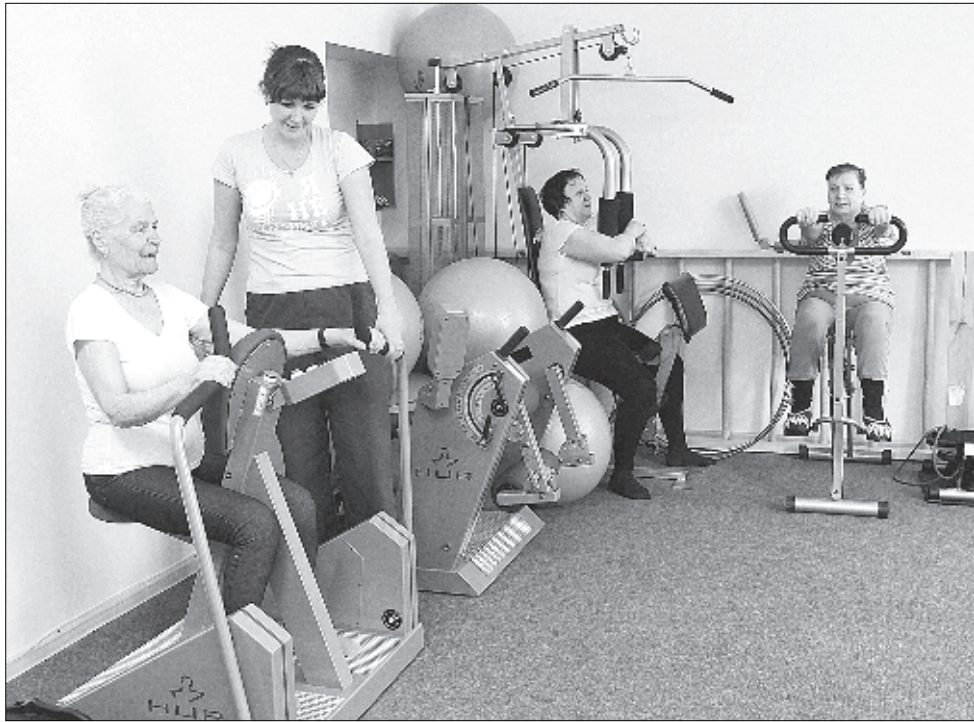
Занятия на тренажерах помогают пожилым миасцам не только поддерживать физическую форму, но и вселяют хорошее настроение и бодрость духа.

Почти два десятка лет работали эти группы, возвращая старшему поколению уверенность в завтрашнем дне. Но за это время многое в обществе изменилось. Пенсии стали выдавать регулярно, потребность в бесплатном питании отпала. Постановлением бывшего губернатора Челябинской области Петра Сумина услуги комплексного центра, оказываемые населению, стали платными, в том числе и находящиеся в группе дневного пре-