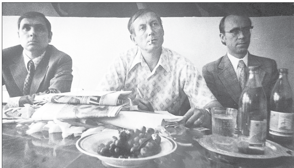
Встреча с поэтом Е. Евтушенко (на снимке в центре).