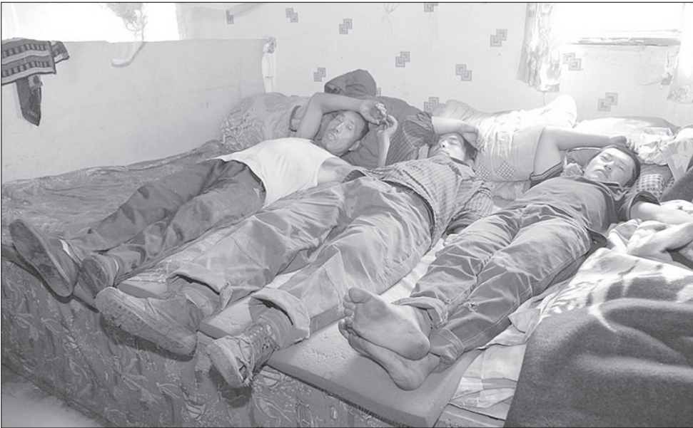
Скоро за услуги «Миассводоканала» придется платить не по количеству прописанных, а по количеству реально проживающих в квартире.

«Миассводоканал» с помощью активных жителей выявляет незарегистрированных жильцов