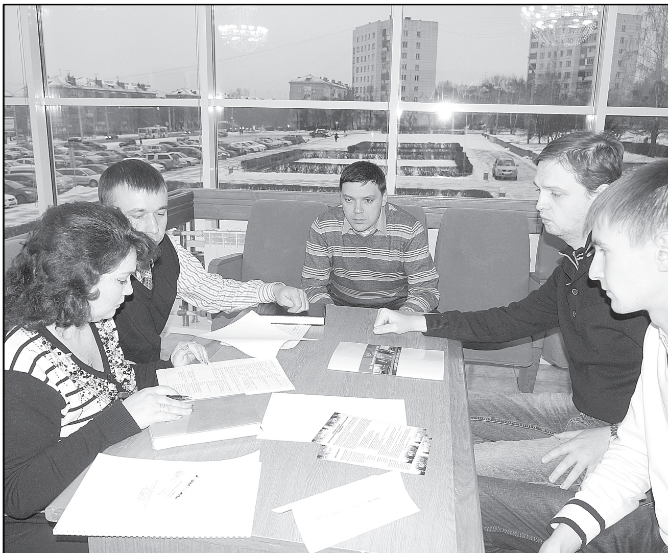
За столом переговоров: заказчики и поставщики нашли друг друга.