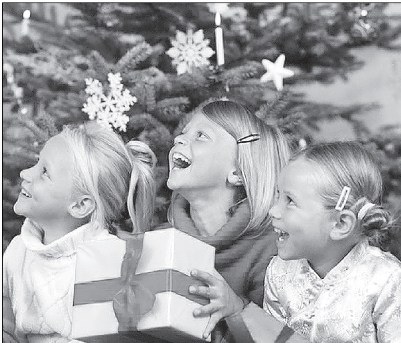
О новогоднем подарке мечтает каждый, независимо от возраста.

Адрес комплексного центра: проспект Макеева, 86, телефон для справок 52-75-20.