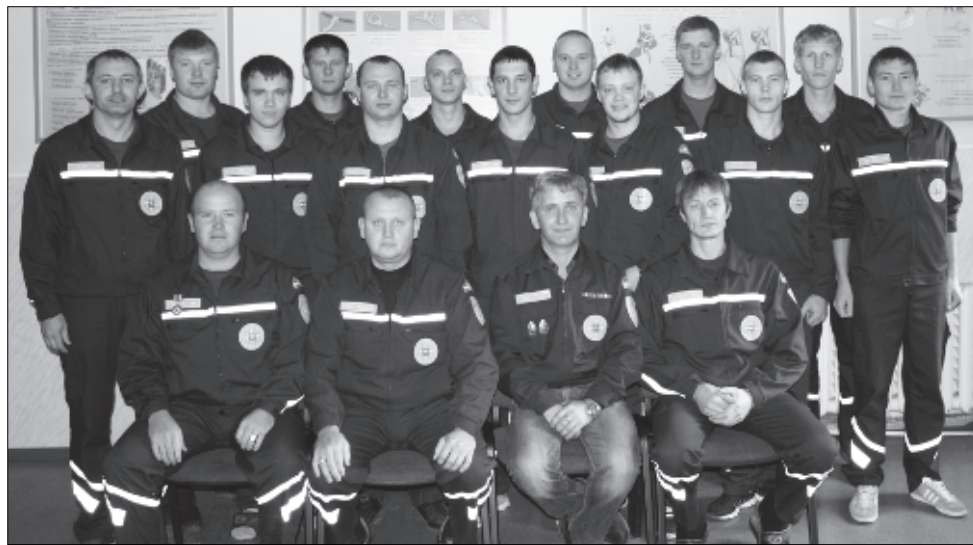
Для них быть спасателями — не работа, а призвание.

Первые полчаса проходят за беседой с остальны-