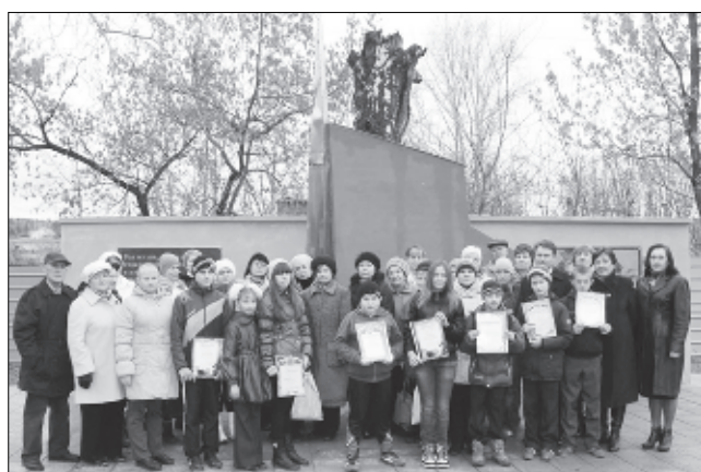
Открытие памятника в 2013 году.