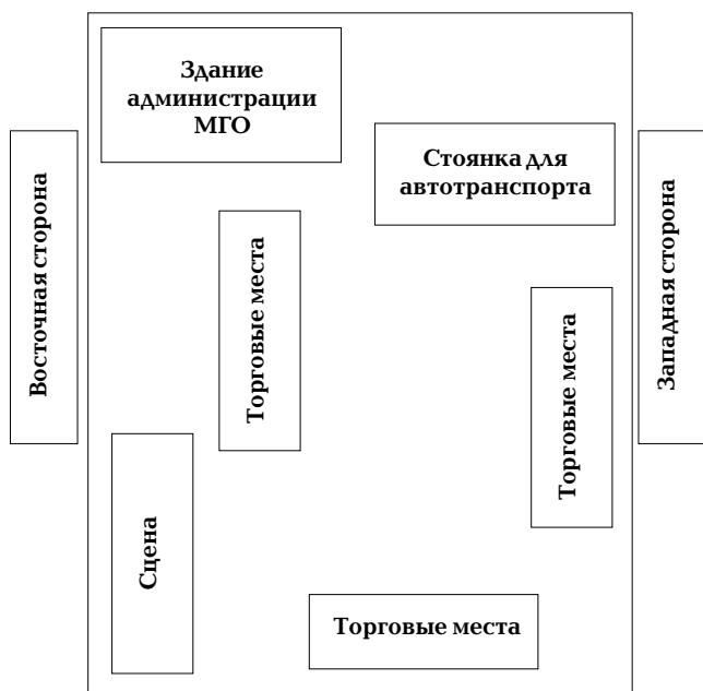
Схема размещения торговых мест на новогодней универсальной ярмарке

к постановлению администрации Миасского городского округа № _____