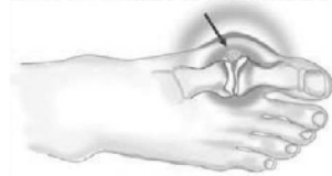
Ревматоидный артрит большого пальца ноги

Названия дистрофических болезней суставов заканчиваются на «-оз» – артроз, остеохондроз. Суть болезни – медленная дегенерация и разрушение внутрисуставного хряща. С течением времени происходит перестройка суставных концов костей и воспаление около-суставных тканей.