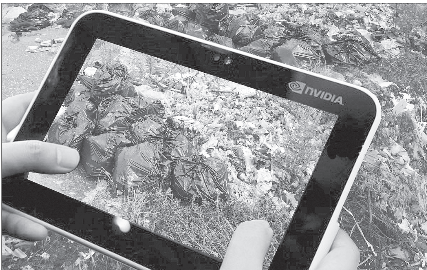
Подтвердить факт загрязнения природы может видео- или фотосъемка.

С каждым годом экология городов и других населенных пунктов нашей страны ухудшается — растут показатели загрязнения, количество несанкционированных свалок. Борьба с этими проблемами Минприроды призывает не только власти, но и рядовых граждан. С этой целью запущен специальный сайт, куда жители любого региона смогут сообщать об экологических нарушениях.