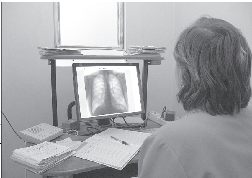
Из-за отсутствия аппарата в ГБ № 2 тысячи миассцев не проходят флюорографию.

? Я пенсионер, флюорографию в центральной части города пройти не могу, ездить на обследование в старый город не позволяет небольшая пенсия. Почему в ГБ № 2 до сих пор нет аппарата? САВЧЕНКО.