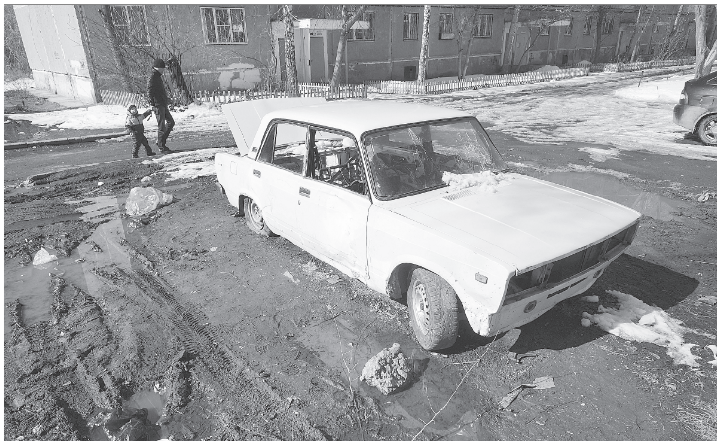
Брошенные автомобили можно увидеть едва ли не в каждом дворе.

Вопрос, что делать со старыми, неиспользуемыми транспортными средствами, брошенными нерадивыми хозяевами во дворах, до недавнего времени оставался открытым. Теперь же проблема будет решаться администрацией МГО законными методами.