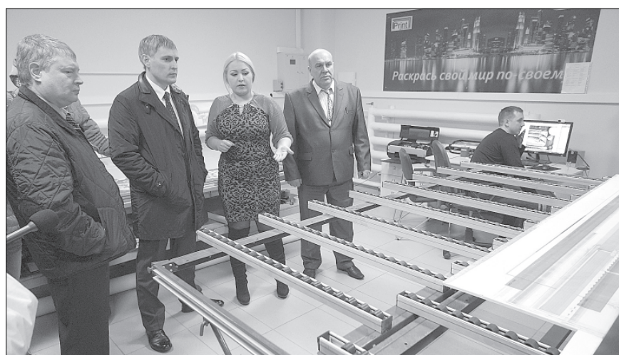
В компании «IPrint» еще есть резервы для развития производства.

Сотрудники полиции в очередной раз предупреждают граждан от передачи денежных средств незнакомым людям, а также просят граждан проводить беседы (чем чаще, тем лучше) со своими престарелыми родственниками о том, что нельзя снимать с книжки деньги и передавать их чужим людям, кем бы они ни представлялись!