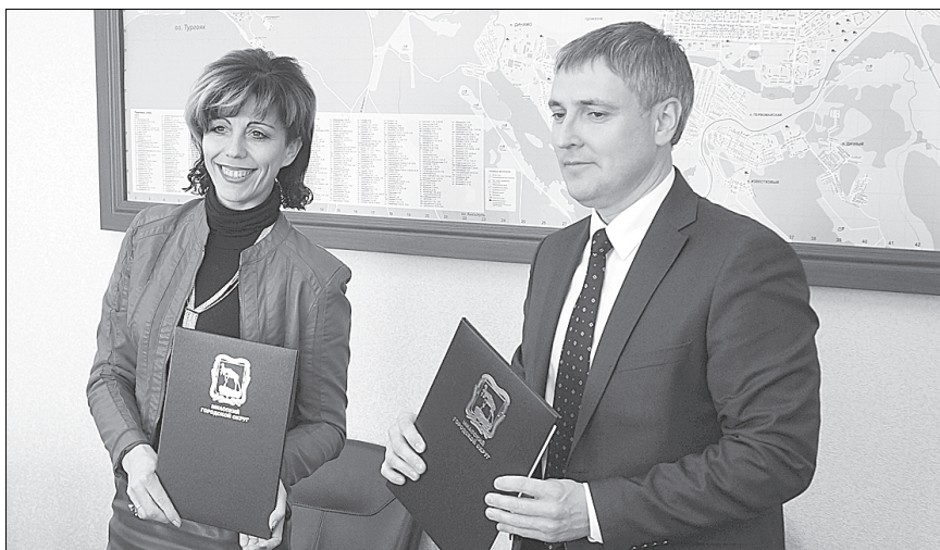
Подписан договор о сотрудничестве между МГО и Миасской торгово-промышленной палатой.

В городе взят курс на поддержку малого и среднего бизнеса