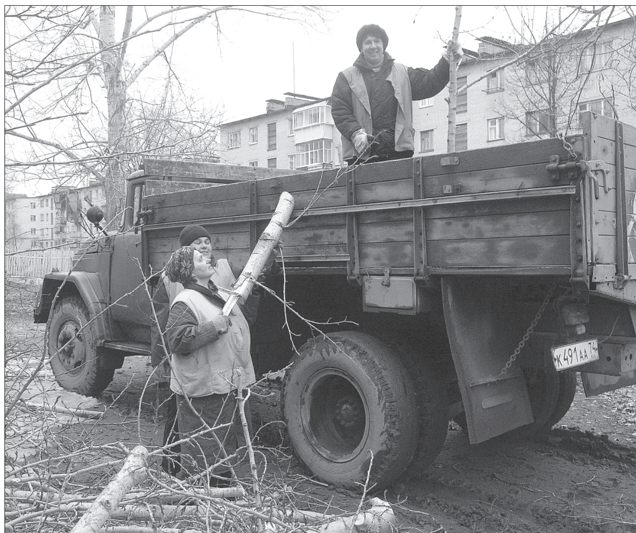
Первыми приводить город в порядок начали управляющие компании.

Кстати, на официальном сайте губернатора gubernator74.ru открыт раздел «Наведем порядок!», где жители могут размещать фотографии территорий своего города, находящихся в ненадлежащем состоянии: раз- рушенные фасады домов, детские площадки, тротуары и т. д.