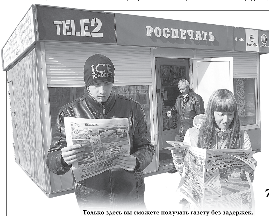
Только здесь вы сможете получать газету без задержек.