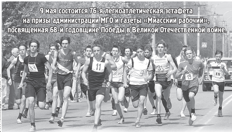
9 мая состоится 76-я легкоатлетическая эстафета на призы администрации МГО и газеты «Миасский рабочий», посвященная 68-й годовщине Победы в Великой Отечественной войне.