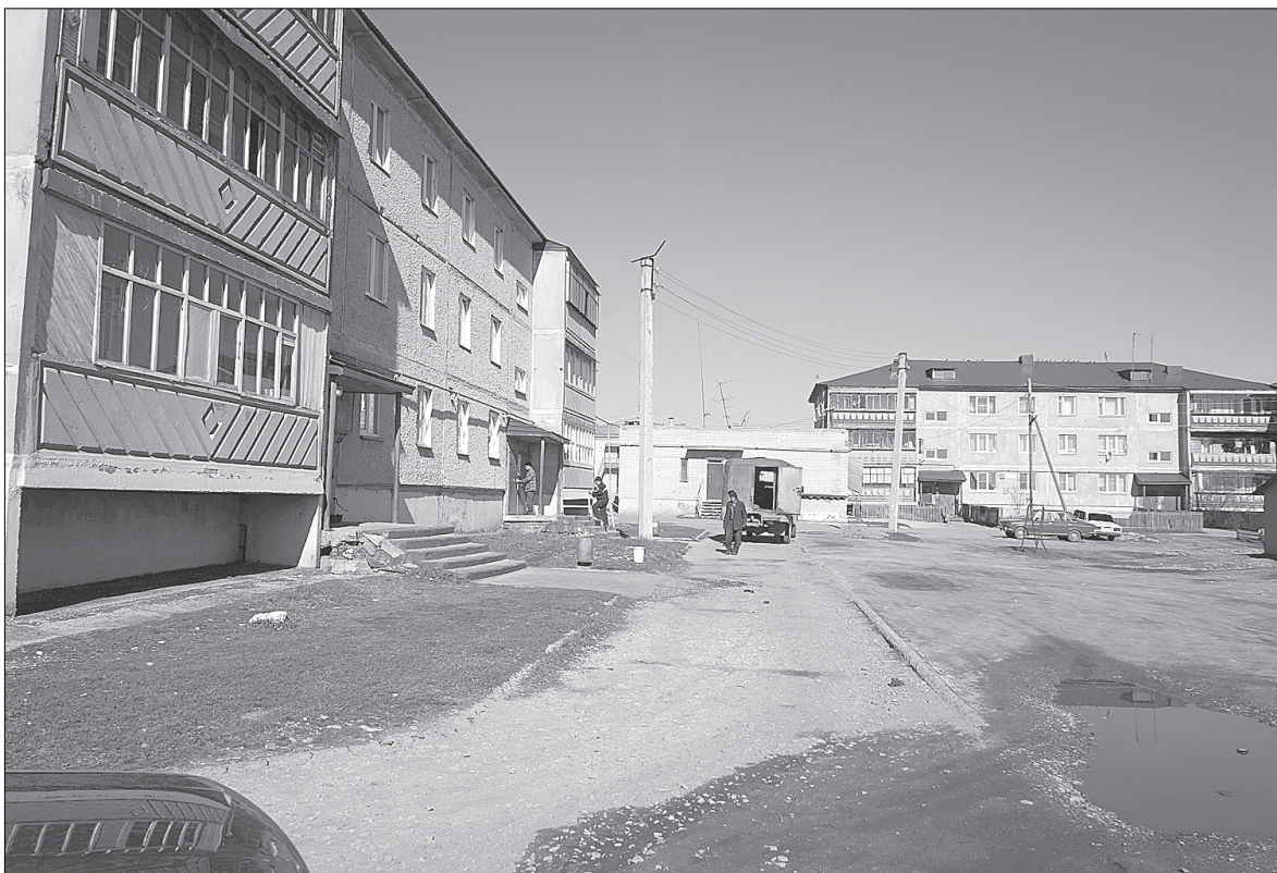
Управляющая компания и жители общими усилиями навести порядок во дворах.

— Мы обслуживаем три котельные: в Черном, Смородинке, Нижнем Атяне. Также занимаемся обслуживанием сетей в этих