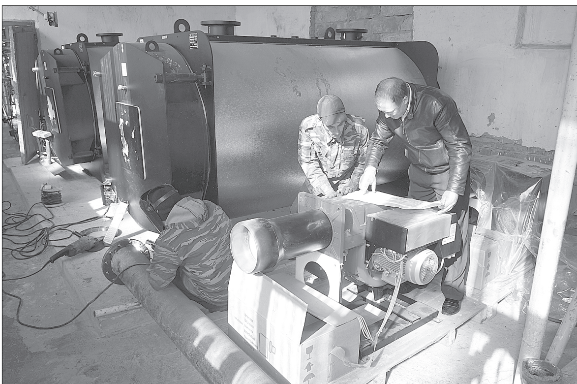
Специалисты «ЮТЭК» уже начали подготовку к очередному отопительному сезону.

населенных пунктах и в поселках Ленинск и Хребет. К сожалению, без срывов во время отопительного сезона не обошлось. В частности, не выдавали должный температурный режим в Смородинке. Причина — в изношенности оборудования. К следующему отопительному периоду проблема будет решена. Предприятие «ЮТЭК» на свои средства приобрело современные итальянские котлы с горелками (оборудование уже поступило). Летом будет производиться их монтаж.