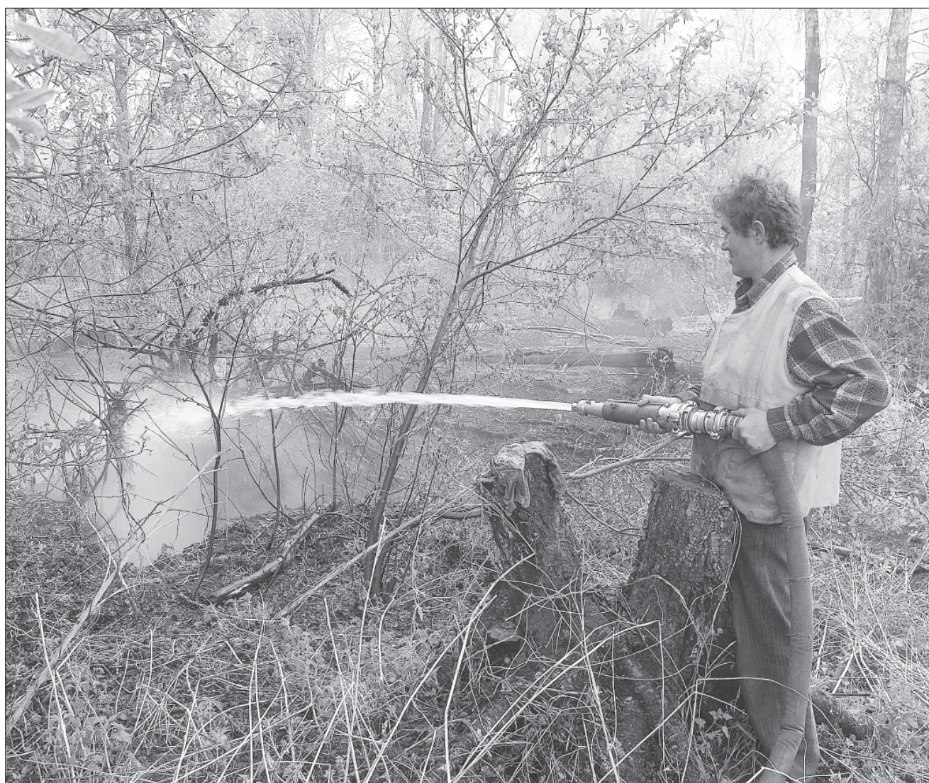
Наибольшее количество лесных пожаров в этом году произошло на территории Гослесфонда.