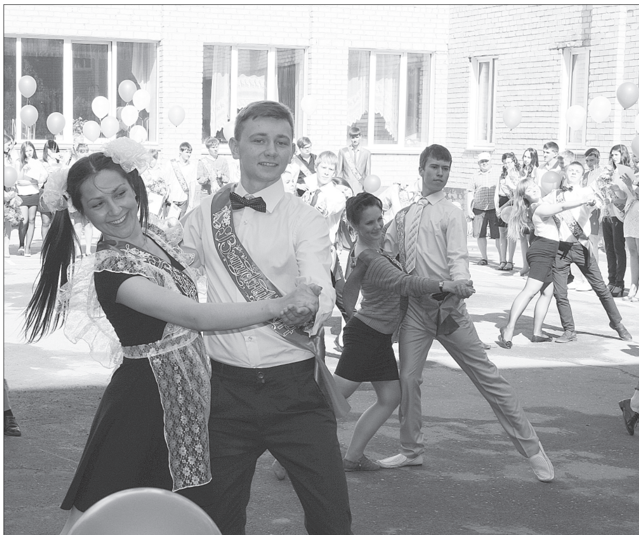
Сегодня танцы, а завтра — экзамены...

Желаем выпускникам удачной сдачи всех экзаменов и самых высоких баллов!