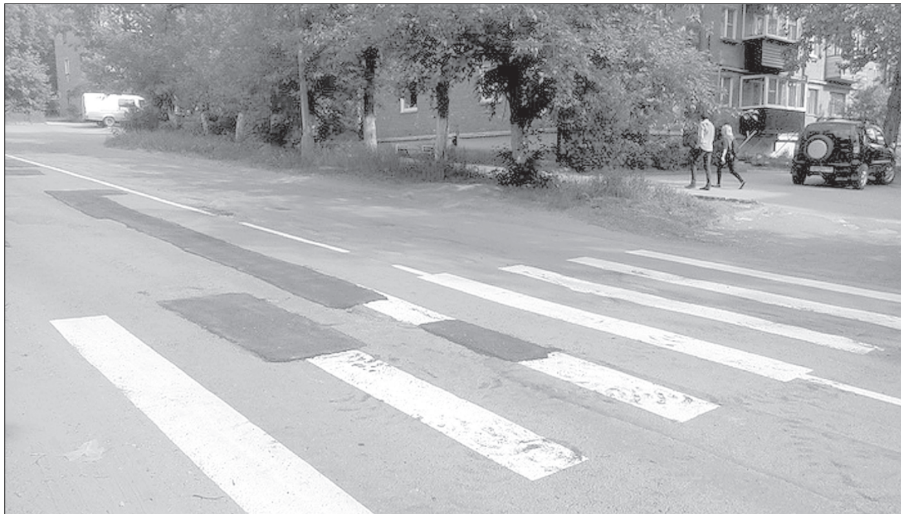
Улица Молодежная буквально пестрит асфальтовыми заплатками.

На городских дорогах сначала появилась разметка, а после был проведен ямочный ремонт. В чем причина несоответствия?