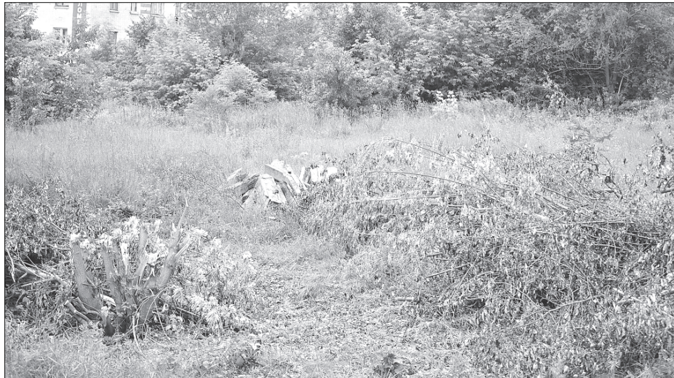
Часть деревьев в сквере уже вырублена.

Застройка зеленой зоны на ул. Уральской временно приостановлена