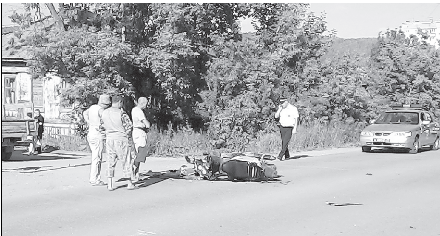
ДТП с участием мототранспорта отличаются особой тяжестью последствий.

За месяц произошло более десятка аварий с участием мототранспорта