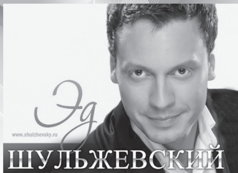
ШУЛЬЖЕВСКИЙ г. Москва

Вас ждут призы и подарки от наших спонсоров!