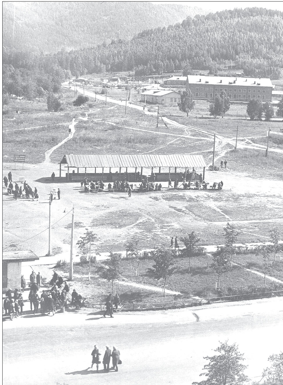
Несколько десятилетий назад на месте электромеханического техникума был расположен рынок.

В 1962 году был сдан широкоэкранный киноте-