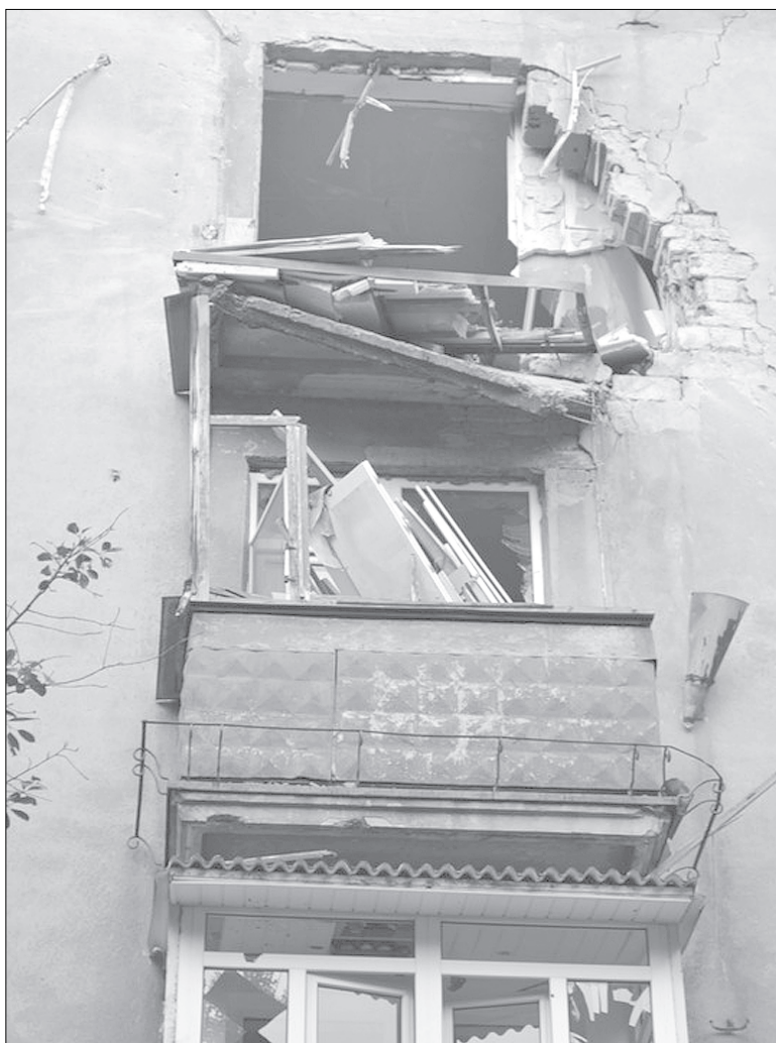
Разрушенные стены, выбитые окна — так сейчас выглядят многие дома в Славянске.

— Мы приехали на машине. На границе Украины, я предполагаю, дежурили сотрудники СБУ. Нас, конечно, что называется, «не вытряхивали», но в тот момент, когда мы уже облегченно вздохнули, полагая, что все обошлось, к нам вышел один из сотрудников и предложил показать всю имеющуюся с