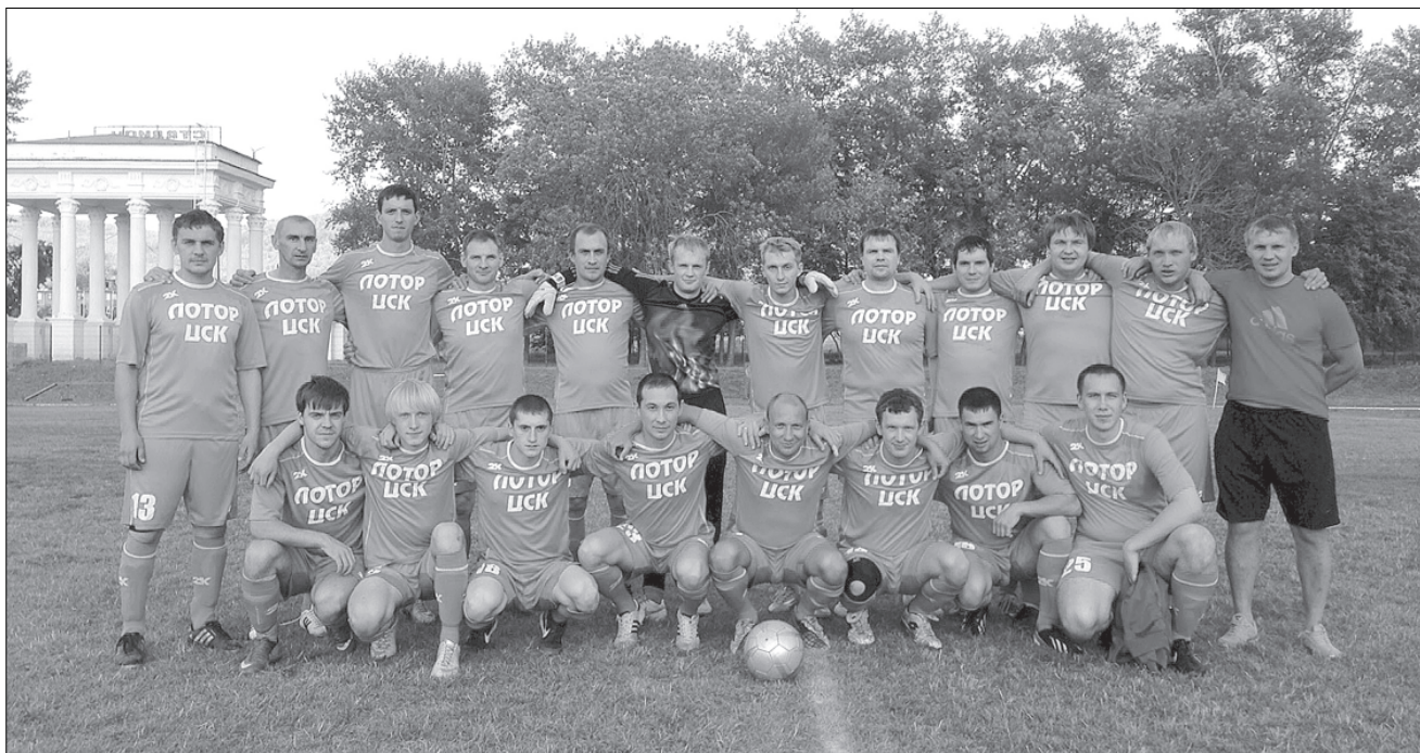
Пройдя долгий путь к успеху, «Лотор-ЦСК» уже два года подряд выигрывает чемпионат города.