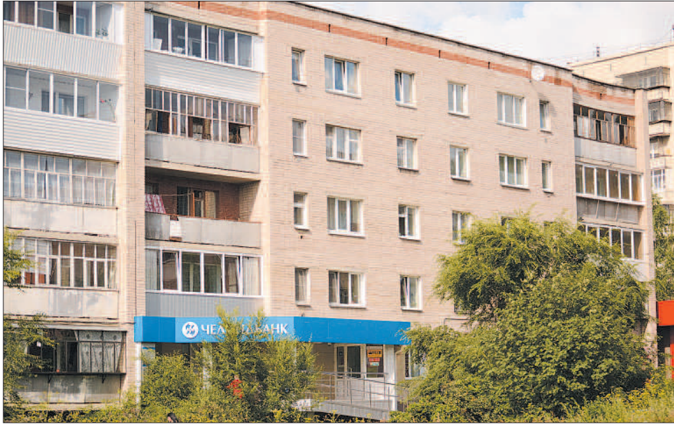
С проблемой протекания крыш столкнулись жители многих домов.

Гроза, накрывшая Миасс на минувшей неделе, превратила улицы города в бурлящие реки. Шквалистый ветер, налетевший на город, принес с собой ливень, который многих застал врасплох. И речь идет далеко не только о тех, кто оказался в этот момент на улице и кому пришлось передвигаться чуть ли не вплавь, но и о жителях, в чьи дома вода просочилась не только с потолка, но и сквозь панельные швы.