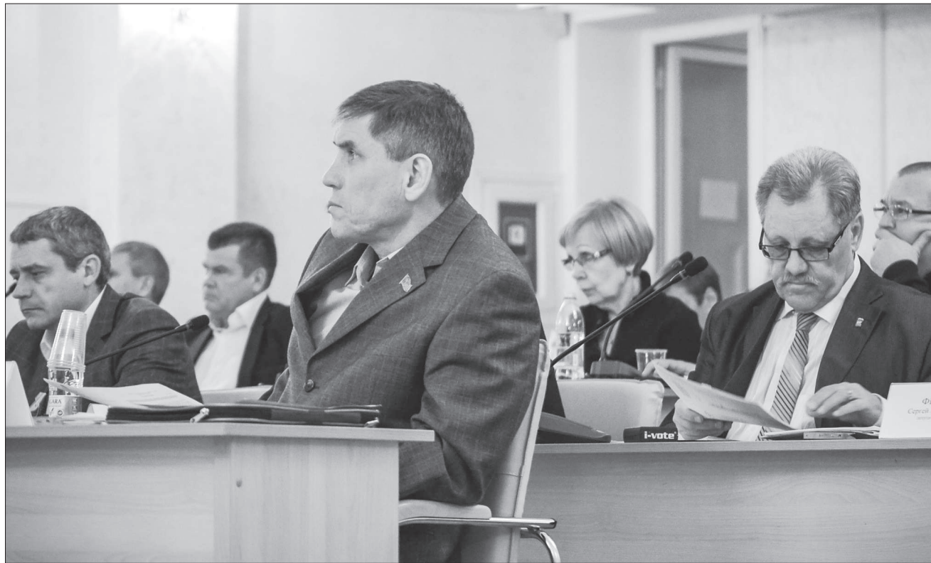
На прошедшей сессии депутаты внесли изменения в бюджет этого года. Впереди у парламентариев — принятие непростого бюджета на следующий год.

Миасские депутаты официально приняли финансовую помощь из областного бюджета