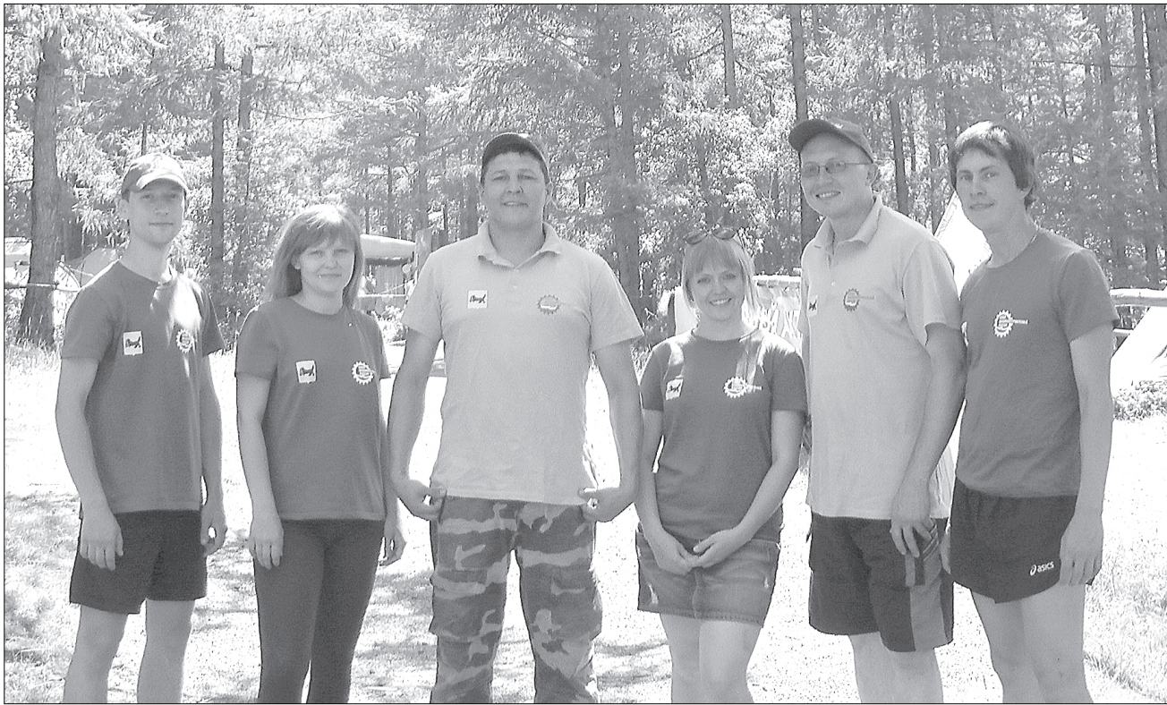
Молодые специалисты АЗ «Урал» показали, что могут работать единой командой.

В результате первое место в старшей группе досталось команде «Bobcats» из Чебаркуля, а миасская команда «Рандом» получила первое место в младшей категории. «Оранжевый мяч» проводится с целью популяризации и развития уличного баскетбола как самого доступного вида спорта среди населения, а также для пропаганды здорового образа жизни среди молодежи.