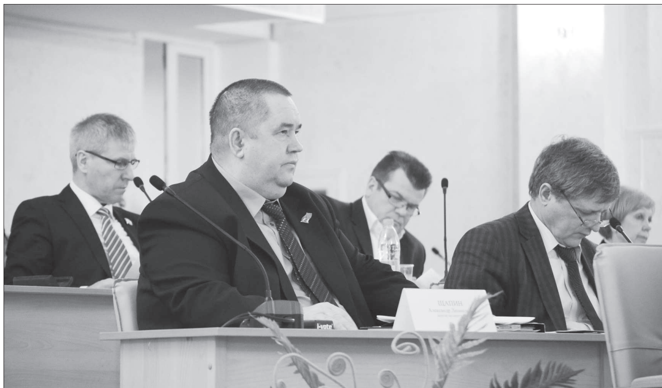
Соглашаясь не перепрофилирование Атлянской колонии, депутаты поставили ряд условий, призванных максимально обезопасить горожан от будущих «соседей».

Депутаты приняли бюджет на будущий год и одобрили перепрофилирование Атлянской колонии