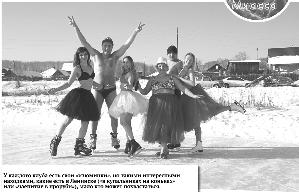
У каждого клуба есть свои «изюминки», но такими интересными находками, какие есть в Ленинске («в купальниках на коньках» или «чаепитие в проруби»), мало кто может похвастаться.

— В другой раз придумали День зонтиков. С областного телевидения нам позвонили: «Можно приехать и поснимать?.. Афишу увидели, заинтересовались. А зонтики