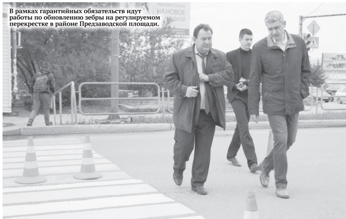
В рамках гарантийных обязательств идут работы по обновлению зебры на регулируемом перекрестке в районе Предзаводской площади.

На улицах Миасса ведется ямочный ремонт и обновляется дорожная разметка