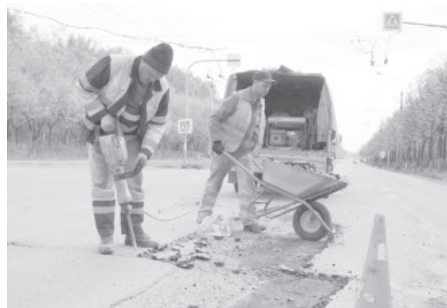
До конца мая планируется привести в порядок основные улицы машгородка.

Во время предыдущего объезда, который проходил около месяца назад, контейнеры и территория около них были сильно захлам-