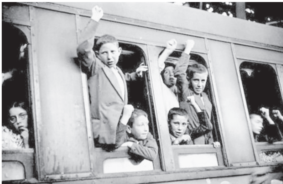
В 1937 году из Испании были эвакуированы свыше 30 тысяч детей из семей республиканцев.

В деревенском клубе Куккуса, освещенном тульской лампочкой, мы на прощание танцевали с ними пасодобль. Его мелодию до сих пор храним в памяти как реликвию нашей трудной и незабываемой юности...».