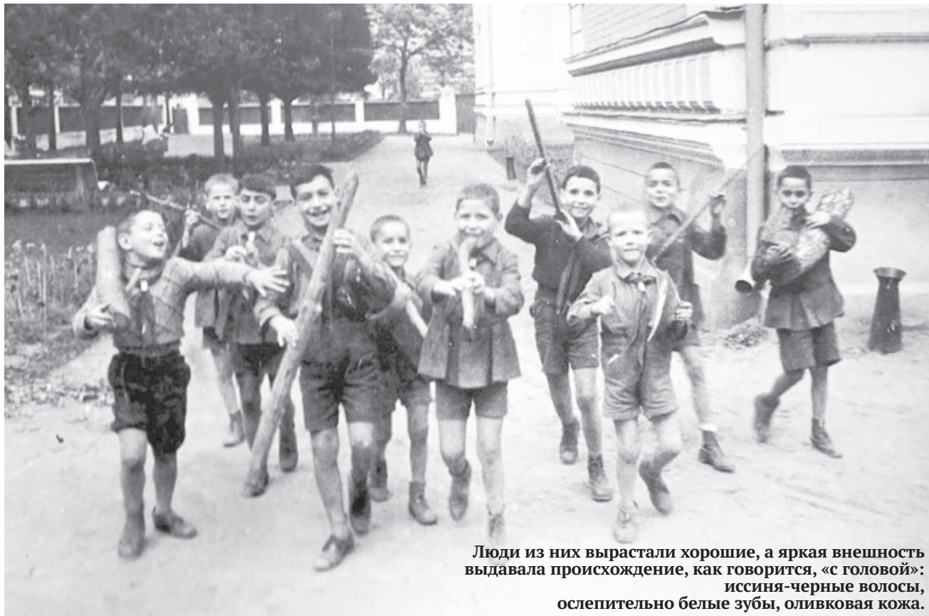
Люди из них выросли хорошие, а яркая внешность выдавала происхождение, как говорится, «с головой»: иссиня-черные волосы, ослепительно белые зубы, оливковая кожа.

Даже волки, воюющие по ночам в степи, не могли нарушить молодой сон.