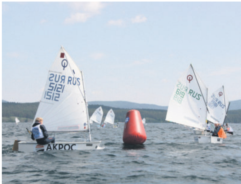
Для участия в регате заявили 94 юных спортсмена из десяти регионов страны. Самыми многочисленными оказались команды из Миасса, Тольятти и Екатеринбургa.

— На земном шаре нет некрасивых мест, так же, как нет некрасивых людей. Как подсчитали мои внуки, я побывал в 125 странах, и я не видел ни одного некрасивого или плохого народа. Все люди красивые, добрые. И мне хочется видеть эту планету. Человеческой жизни не хватает, чтобы познать всю эту красоту. Так что путешествовать никогда не надоедает. Мы только начали открывать Землю. Мировой океан исследован всего на три процента. Так что хватит открытий и нашим детям, и внукам, и более далеким потомкам. Главное, чтобы мы жили дружно и берегли нашу планету. Очень уж быстро мы ее старим и загрязняем.