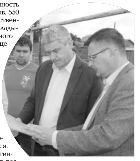
Глава округа Григорий Тонких проверил ход работ по газификации.

— Надеюсь, что к отопительному периоду все работы закончатся. Все жители и участники инициативных групп, которые в свое время разработали проекты, в первую очередь подключатся к газу, — резюмировал Григорий Тонких.