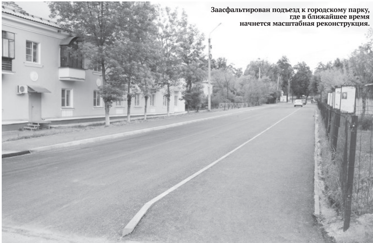
Заасфальтирован подъезд к городскому парку, где в ближайшее время начнется масштабная реконструкция.

В Миассе стартовали работы по благоустройству