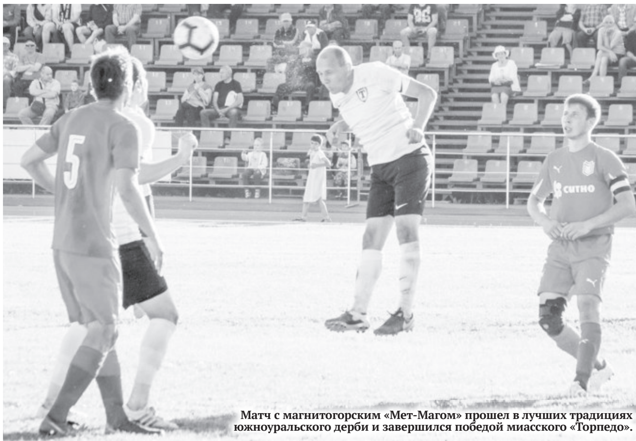
Матч с магнитогорским «Мет-Магом» прошел в лучших традициях южноуральского дерби и завершился победой миасского «Торпедо».

Выезд к принципиальному сопернику в Ашу ожидался с большим интересом. Его подогревало то, что «Металлург» неожиданно «забуксовал», чем породил надежды на благополучный исход. Две ничьи перед игрой с «Торпедо» в Коркино и Челябинске подпорти-