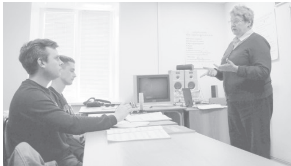
Студенты могут гордиться: имя их педагога занесено в московскую энциклопедию «Жемчужина» наряду с другими талантливыми людьми России.

— Конечно, есть! — искренне удивляется собеседница. — Зимними вечерами вяжу свитера родным. Летом у меня сад. А то, что постоянно ищу что-то новое — это, наверное, от родителей.