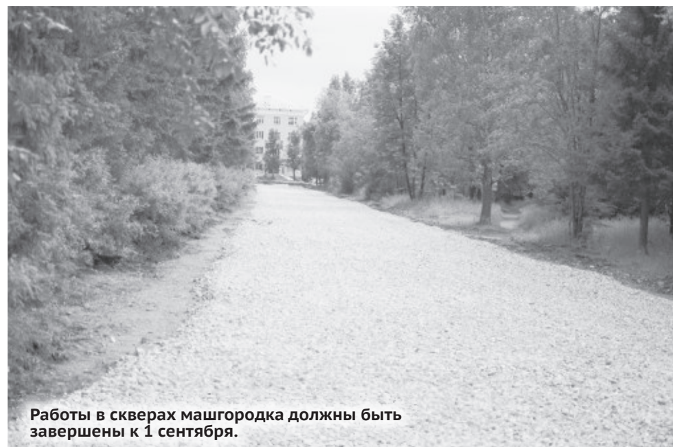
Работы в скверах машгородка должны быть завершены к 1 сентября.