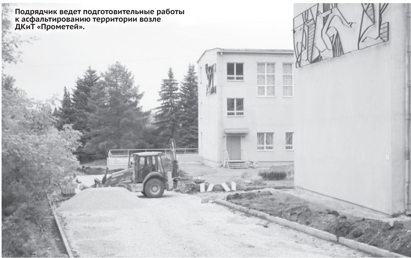
Подрядчик ведет подготовительные работы к асфальтированию территории возле ДКиТ «Прометей».