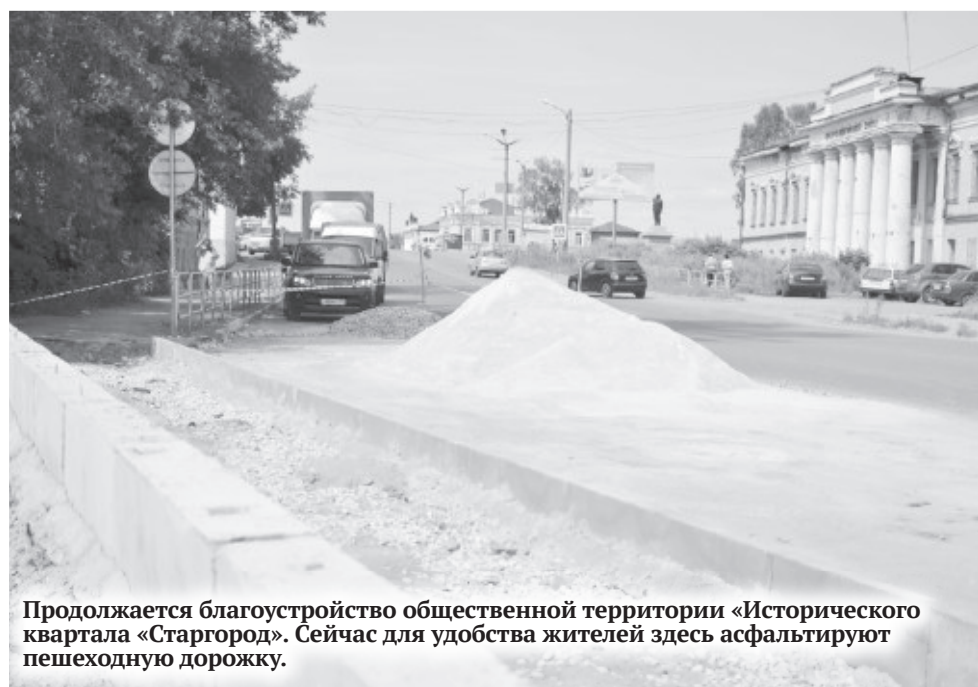
Продолжается благоустройство общественной территории «Исторического квартала «Старгород». Сейчас для удобства жителей здесь асфальтируют пешеходную дорожку.

Преобразилась и территория детской поликлиники, расположенной в доме № 148 на улице 8 Марта. Здесь подрядчик также организовал долгожданный парковочный карман, заасфальтировал въезд во двор и выполнил благоустройство у самой поликлиники. Радует глаз юных посетителей и их родителей и новый арт-объект — сказочный Айболит.