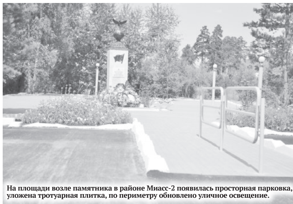
На площади возле памятника в районе Миасс-2 появилась просторная парковка, уложена тротуарная плитка, по периметру обновлено уличное освещение.