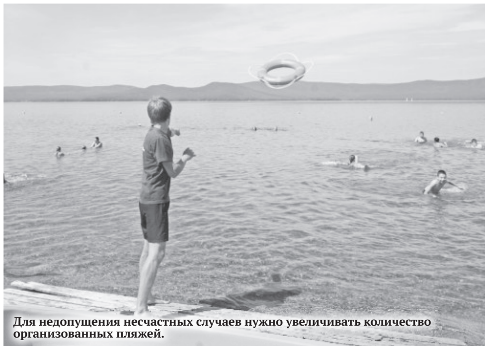
Для недопущения несчастных случаев нужно увеличивать количество организованных пляжей.

«Помимо экстренных мер мы должны позаботиться и о будущем, ведь проблема безопасности на воде будет актуальной ежегодно, особенно с учетом того, какое количество водоемов в Челябинской области. Запретить людям отдыхать на этих водоемах невозможно, нужно создать им безопасные условия, то есть увеличить количество организованных пляжей», — уверен Алексей Текслер.