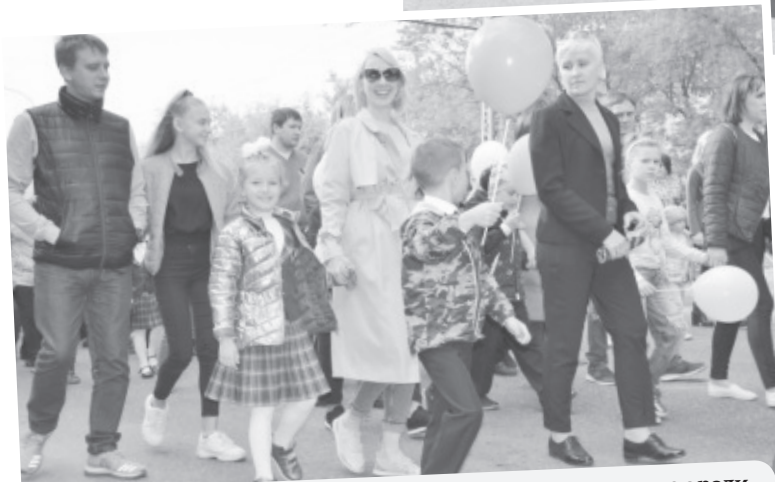
Начался праздник с парада первоклассников, которые вместе с родителями, бабушками и дедушками, младшими и старшими братьями и сестрами колонной прошли по главному проспекту города.