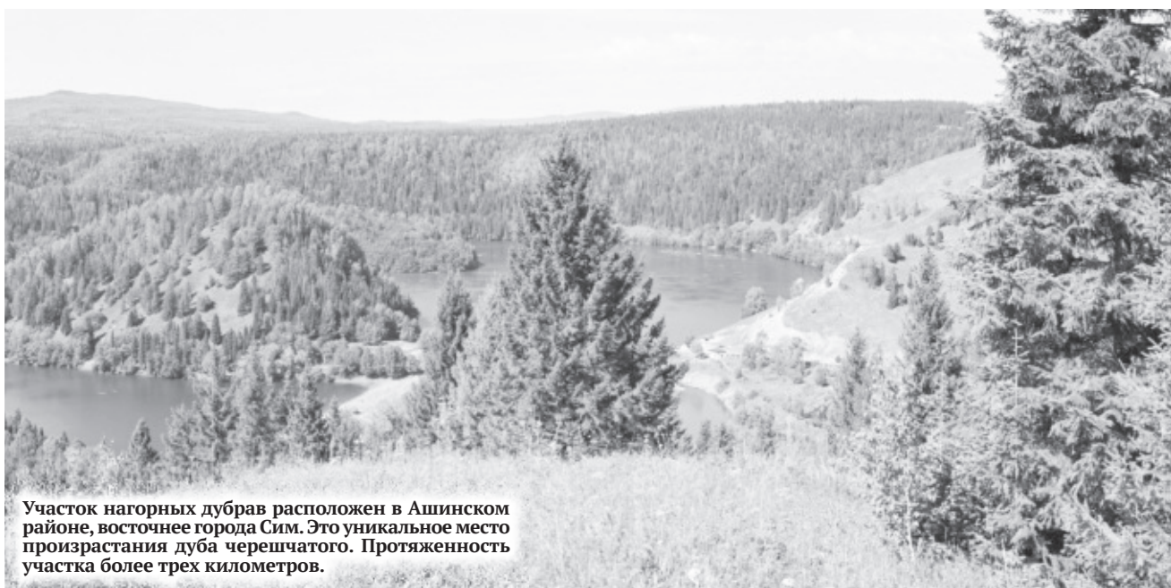
Участок нагорных дубрав расположен в Ашинском районе, восточнее города Сим. Это уникальное место произрастания дуба черешчатого. Протяженность участка более трех километров.

«Принятые правительством области положения устанавливают режим особой охраны территории памятников природы. Он предусматривает целый ряд ограничений. Так, на территории памятников природы запрещается предоставление земельных участков, использование земельных и лесных участков под застройку, движение и стоянка транспортных средств вне дорог. Также здесь нельзя проводить изыскательские, взрывные, буровые работы, добывать ископаемые. Категорически запрещен сброс отходов производства и потребления, выпас и прогон скота, промышленная заготовка лекарственных растений, ягод, грибов. Кроме того, на территории памятников природы недопустимо нанесение каких-либо