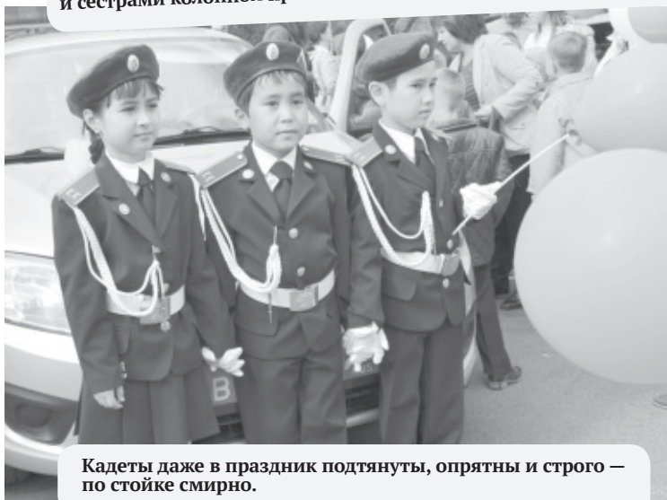
Кадеты даже в праздник подтянуты, опрятны и строго — по стойке смирно.