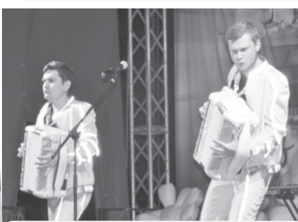
Замечательная концертная программа, в которой приняли участие не только местные звезды, но и приглашенные артисты, не оставила никого равнодушным. На сцене — «Баян-позитив» из Магнитогорска. В финале празднования — под дружное «Ура!» горожан — фаер-шоу и большой салют.