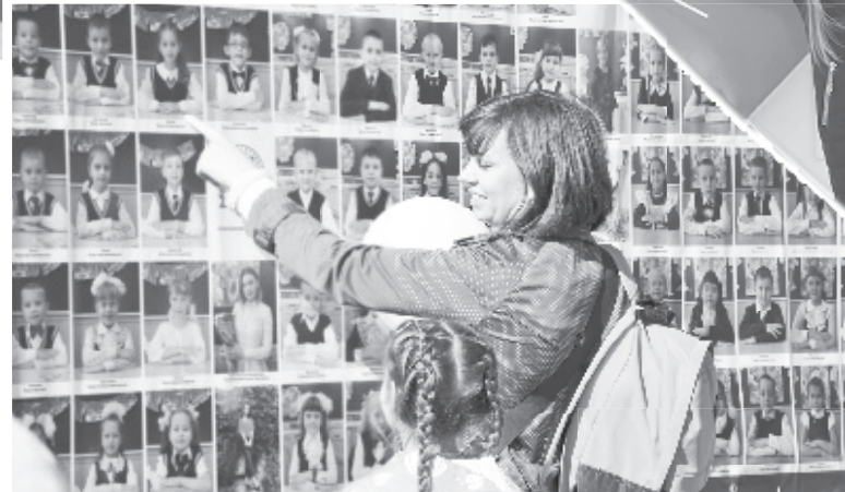
На аллее первоклассников, которая появилась в честь Дня знаний на площади перед администрацией МГО, найти себя нелегко. А если постараться?..