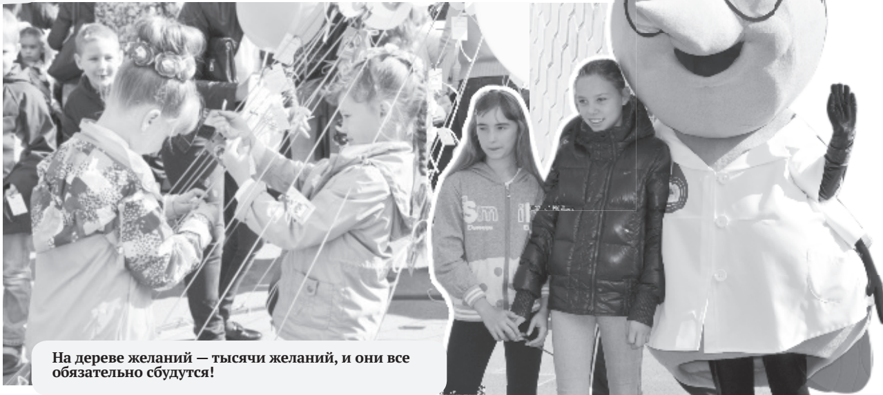
На дереве желаний — тысячи желаний, и они все обязательно сбудутся!