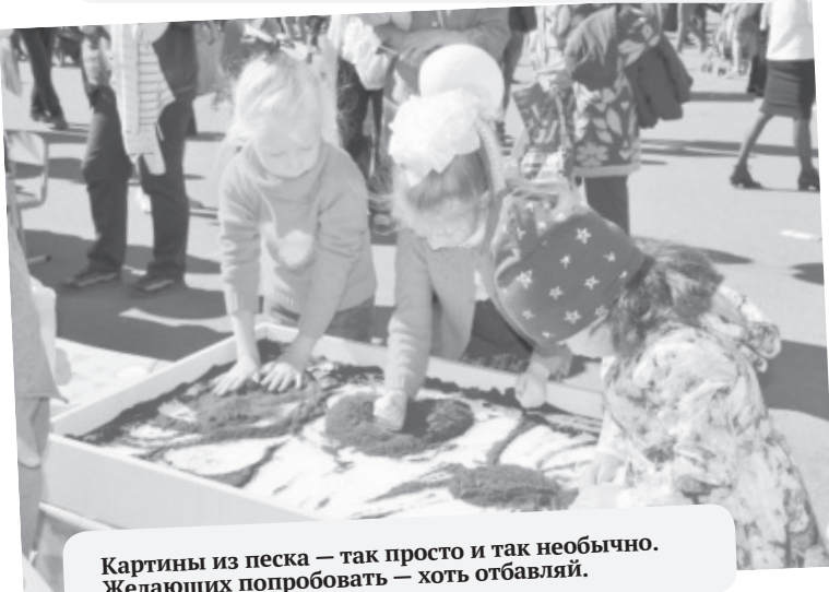
Картины из песка — так просто и так необычно. Желающих попробовать — хоть отбавляй.