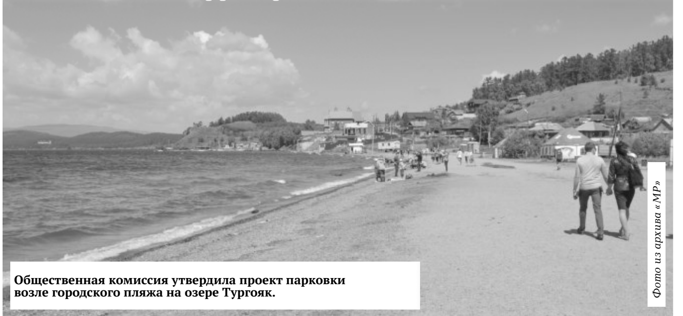
Общественная комиссия утвердила проект парковки возле городского пляжа на озере Тургояк.