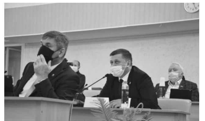
Заседания постоянных комиссий проходят интенсивно, чему совсем не препятствует пандемия коронавируса.

Уральской торгово-промышленной палаты. На размер платы, помимо базовой ставки одного квадратного метра, будет влиять месторасположения НТО, удаленность от остановок общественного транспорта. В случае оформления объекта в соответствии с дизайн-кодом владельцам будет предоставляться льгота. В пояснительной записке к проекту решения приведены примеры расчета оплаты за НТО в разных районах округа. По некоторым объектам разница в суммах платы, рассчитанной по старой и новой методикам, незначительна, в других случаях довольно ощутима. Наведением порядка в размещении и эксплуатации нестационарных торговых объектов Собрание депутатов занялось в предыдущем созыве, в 2019 году было принято положение «О порядке размещения нестационарных торговых объектов на территории Миасского городского округа».