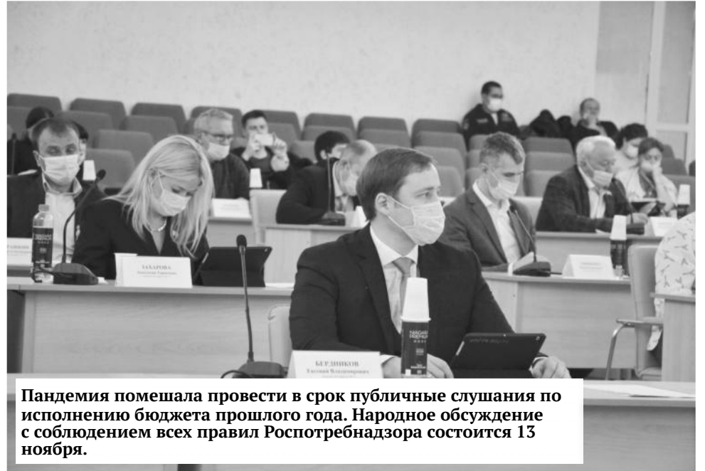
Пандемия помешала провести в срок публичные слушания по исполнению бюджета прошлого года. Народное обсуждение с соблюдением всех правил Роспотребнадзора состоится 13 ноября.

Шестой созыв избранного в сентябре Собрания депутатов входит в рабочий ритм. Заседания постоянных комиссий проходят интенсивно, чему совсем не препятствует пандемия коронавируса. И в малом количестве депутаты теперь встречаются исключительно в конференц-зале, где проще соблюдать социальную дистанцию. Маски на поллица как повседневный атрибут тоже не удивляют.