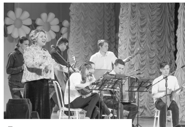
Праздничное настроение создавали творческие коллективы города.