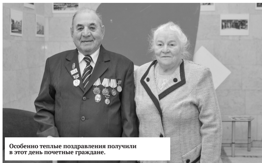
Особенно теплые поздравления получили в этот день почетные граждане.

Черета торжеств, посвященных 246-летию Миасса, традиционно завершилась праздничным вечером в ДК автомобилистов. Поздравить горожан с праздником пришли представители областных и городских властей, депутатского корпуса, крупных предприятий, почетные граждане.