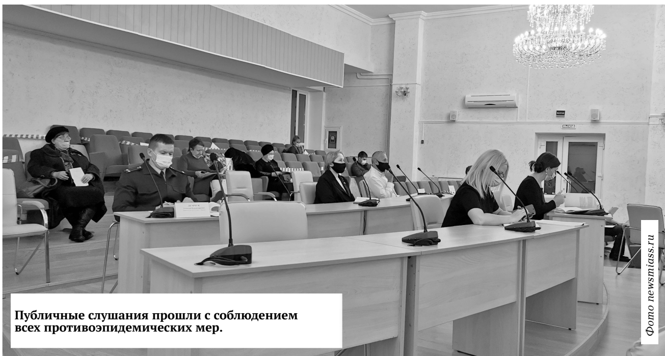
Публичные слушания прошли с соблюдением всех противоэпидемических мер.

В Миассе обсудили исполнение бюджета и изменения в Устав округа