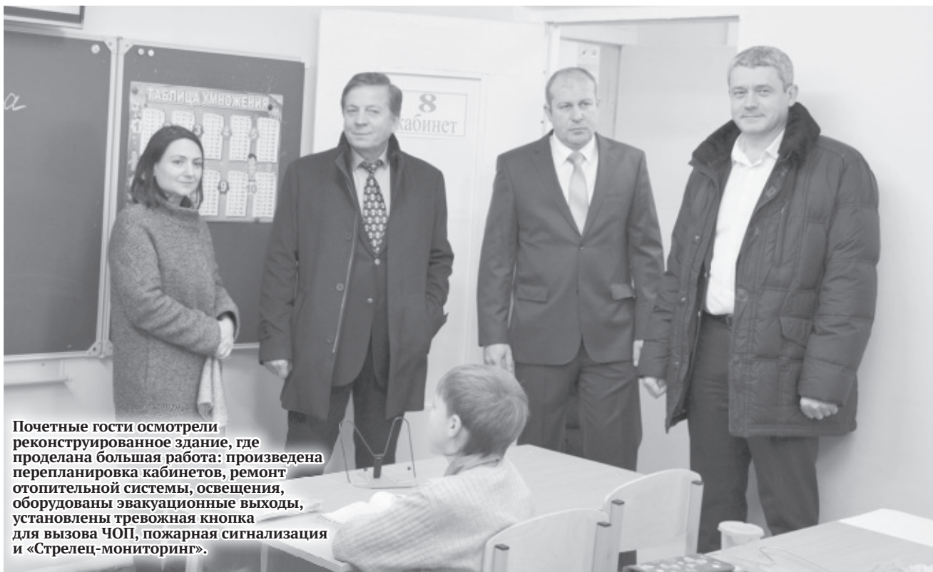
Почетные гости осмотрели реконструированное здание, где проделана большая работа: произведена перепланировка кабинетов, ремонт отопительной системы, освещения, оборудованы эвакуационные выходы, установлены тревожная кнопка для вызова ЧОП, пожарная сигнализация и «Стрелец-мониторинг».

все необходимое для занятий, включая проекторы. Кроме того, обучение сопровождается психолого-логопедической службой, планируются занятия по программам дополнительного образования и внеуроч-