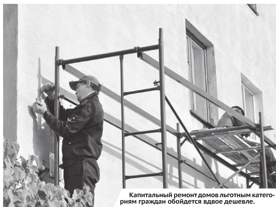
Капитальный ремонт домов льготным категориям граждан обойдется вдвое дешевле.