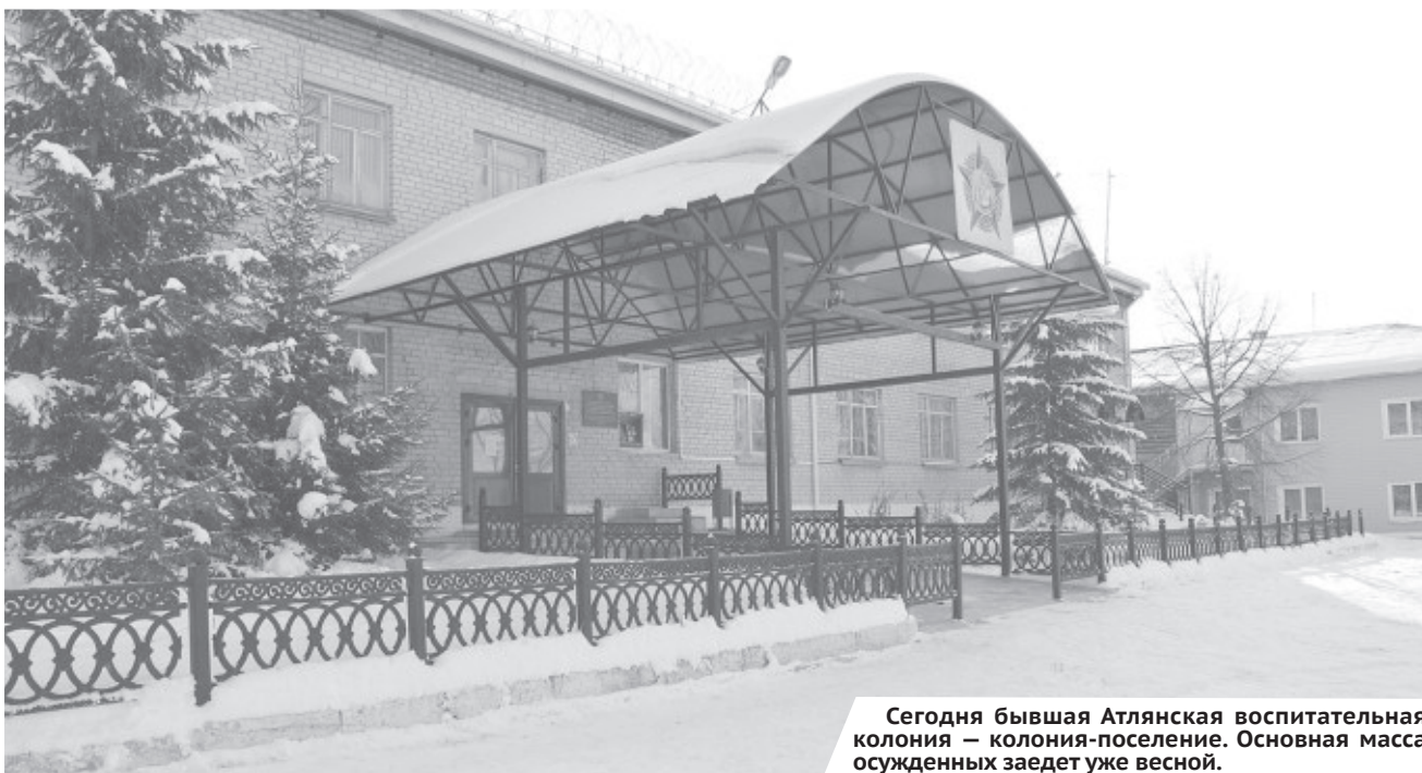
Сегодня бывшая Атынская воспитательная колония — колония-поселение. Основная масса осужденных заедет уже весной.