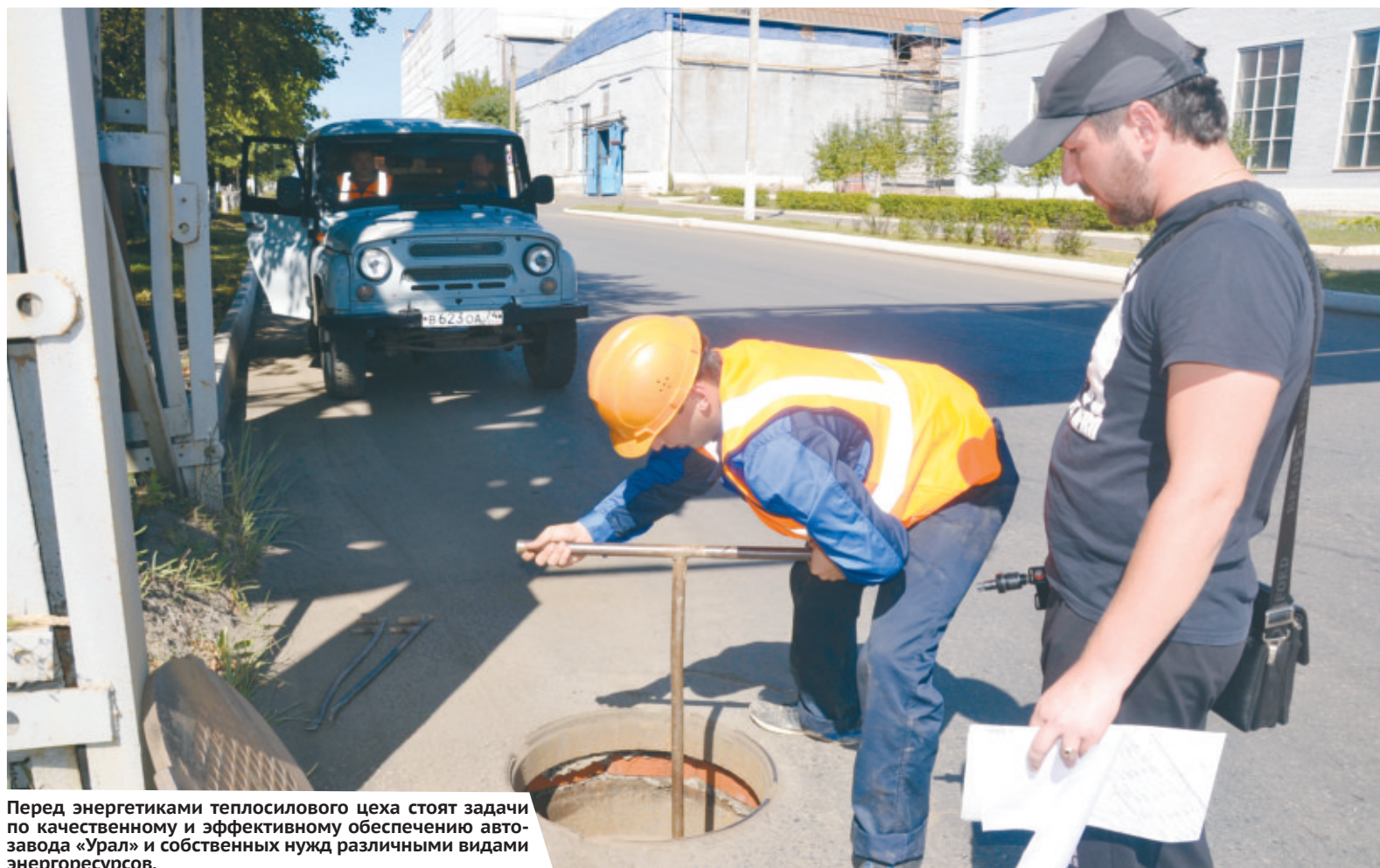
Перед энергетиками теплосилового цеха стоят задачи по качественному и эффективному обеспечению автозавода «Урал» и собственных нужд различными видами энергоресурсов.

В 1948 году цех переименовывают в энергоснабжающий, с 1957 — в энергоцех, с 1964 — в теплосиловой цех.