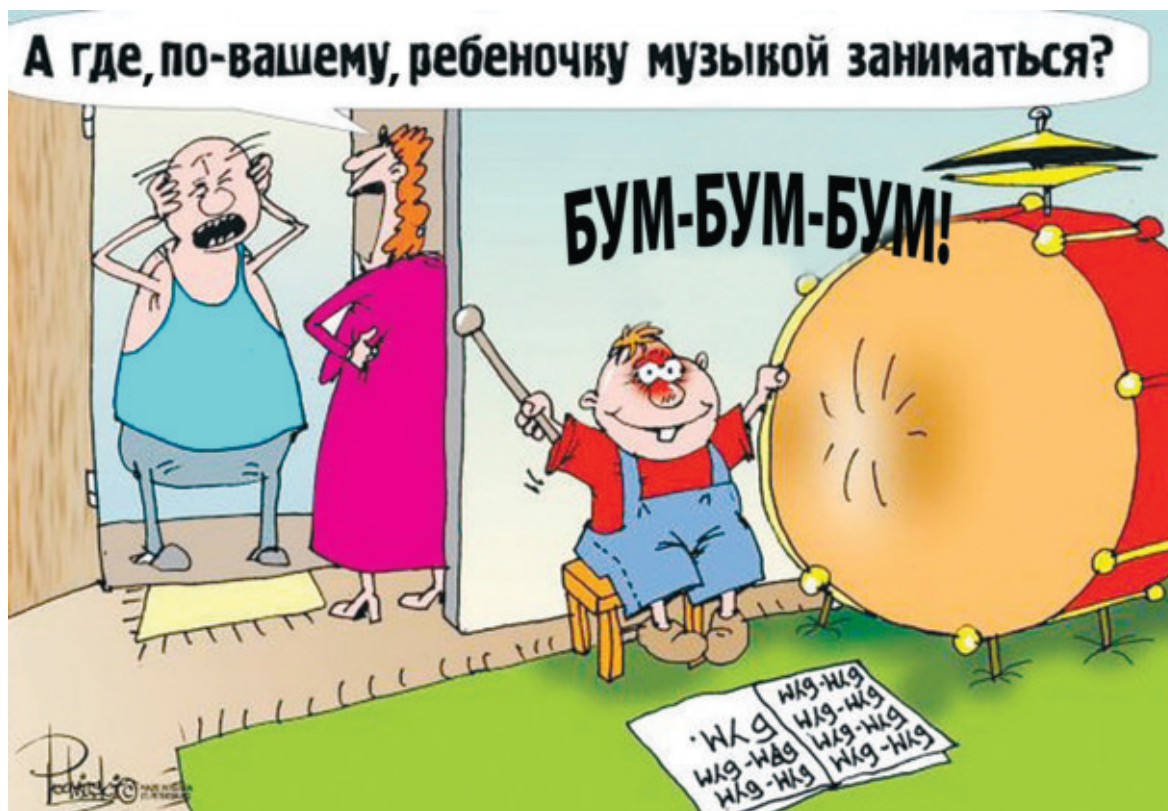
Карикатура с сайта mtsdnp.me.