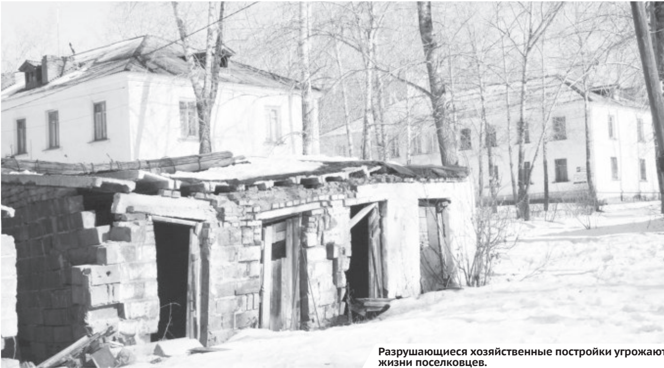
Разрушающиеся хозяйственные постройки угрожают жизни поселковцев.